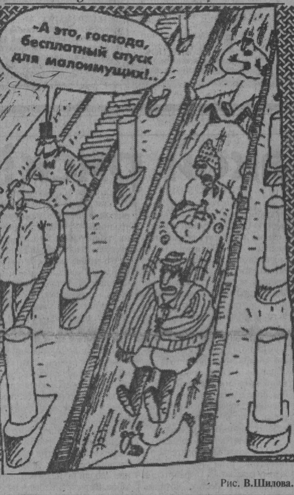
Рис. В. Шилова.