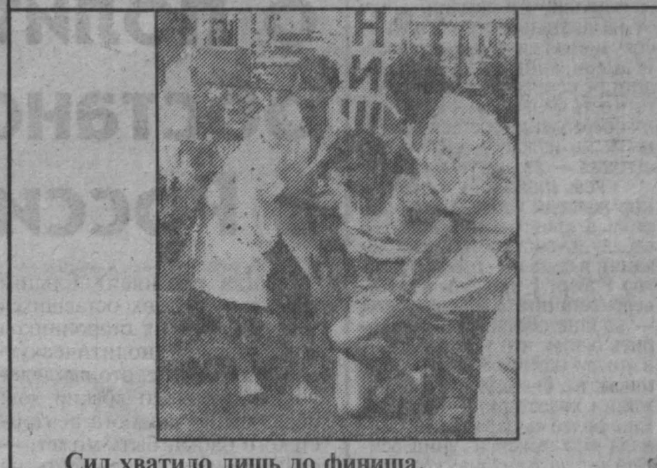
Сил хватало лишь до финиша.

После семи туров лидерство сохранил Каспаров, у которого 5,5 очка. У Иванчука — 5, у Шорта и Крамника — по 4,5, на полочке меньше у Топалова.