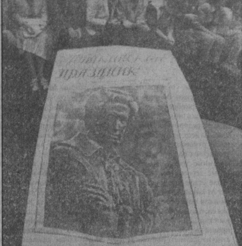
6 июня — 29-й пушкинский праздник поэзии. посвященный 196-летию со дня рождения А.С.Пушкина.

С работами Новокузнецкого театра кукловод познакомился также заведующий отделом детских театров Союза театральных деятелей России, критик О. Глазунова и ответственный секретарь Российского отделения