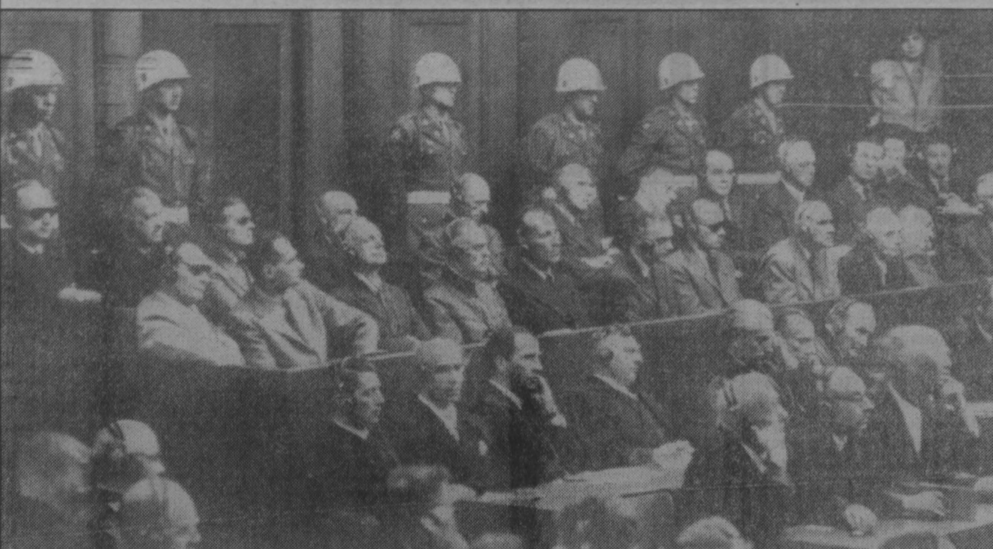
Нюрнберг. Судебный процесс над главными немецкими военными преступниками в специально учрежденном международном военном трибунале (1945-1946 гг.).