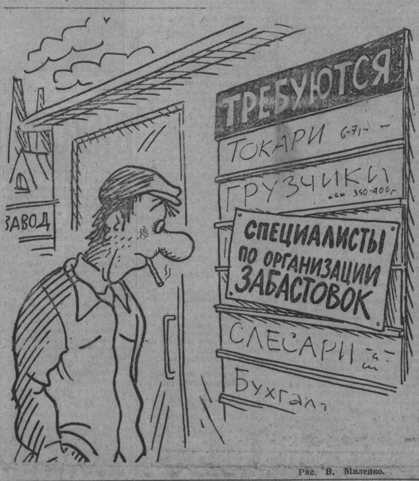
Рис. В. Миленко.