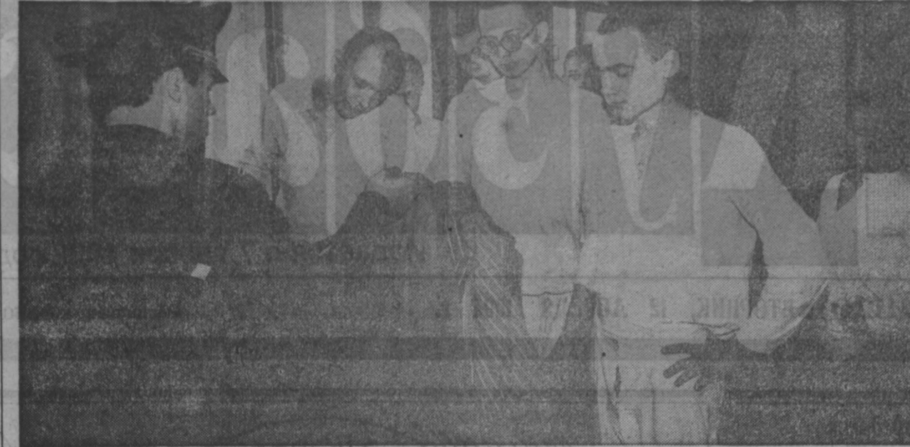
Этот снимок сделан в детской колонии в г. Мариинске. Что ждет в будущем этих ребят, которых мы сегодня называем малолетними преступниками?