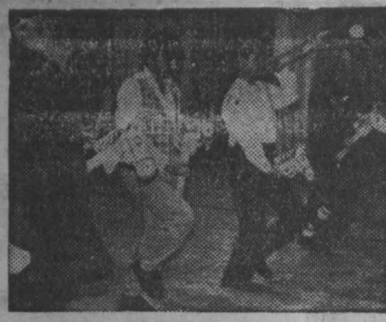
На этом снимке — эпизод гала-концерта фестиваля «Кузбасс. КМ-94». Два вечера молодежный праздник проходил в Кемерове, в помещении Театра оперетты Кузбасса.

«горячий» телефон: наши корреспонденты передают