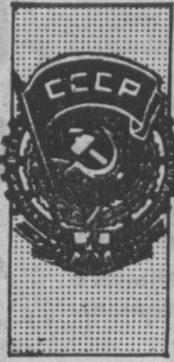
Рис. В. Архипова.