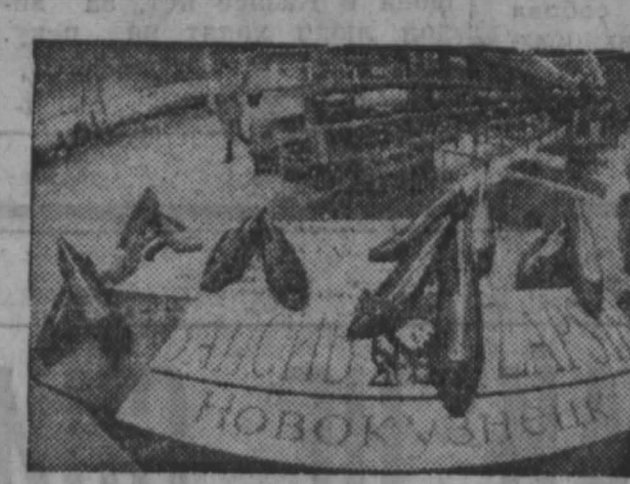
В газете «Кузбасс» коротко уже сообщалось, что в акционерном обществе «Западно-Сибирский металлургический комбинат» выдана веревку продукцию своей обшивной фабрике. Таким образом, Запсиб стал поставщиком не только металлопродукта, но и разных моделей женской, мужской и детской обуви.

Надо сказать, что освоение принципиально новой для себя профессии записки металлургии занялись не вадру и не сразу. И при этом преследовали несколько целей. Во-первых, в результате рационализации производства высвободилось немало женщин, которым надо было трудоустройство, во-вторых, хоте-