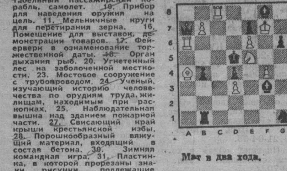
Игра в два хода.