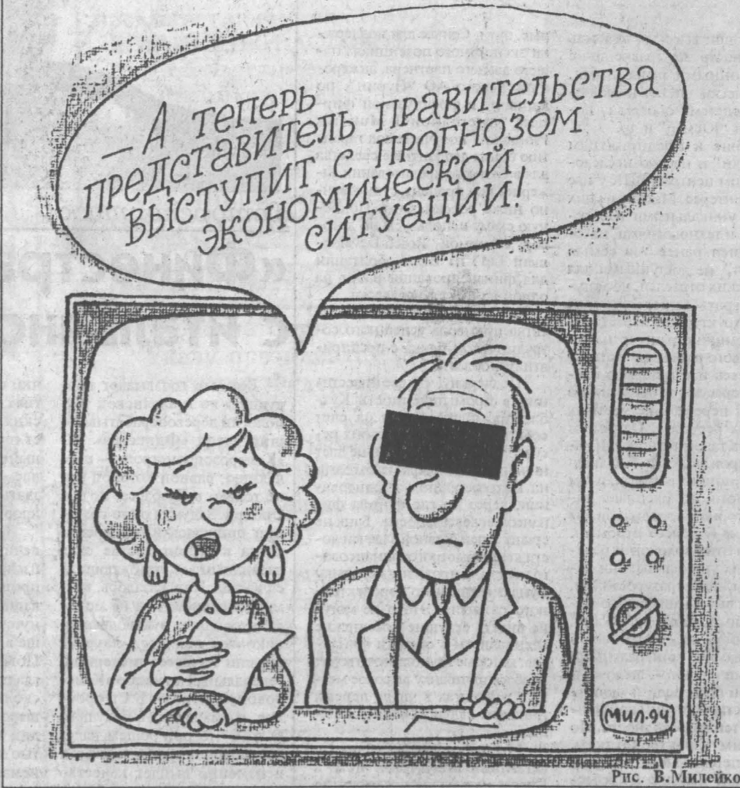
Рис. В. Милейко.