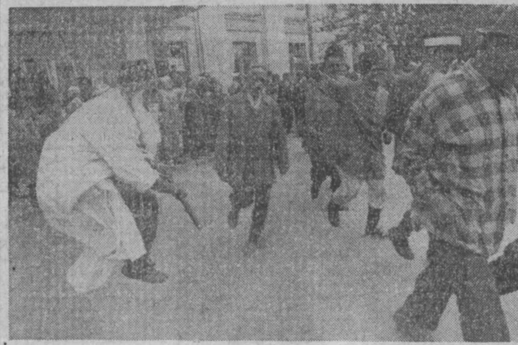
НА СНИМКЕ: в поддержку Д.Дудаева исполняется религиозный обряд сунитов «зикр».