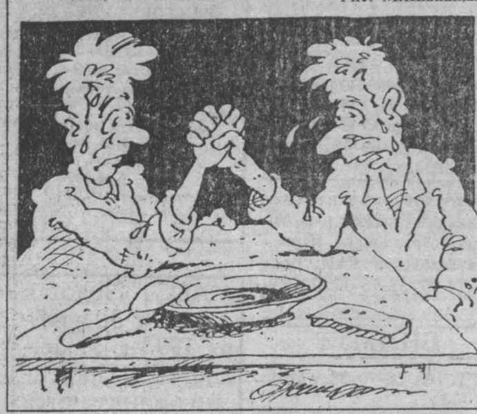
Рис. М. Жилкина.