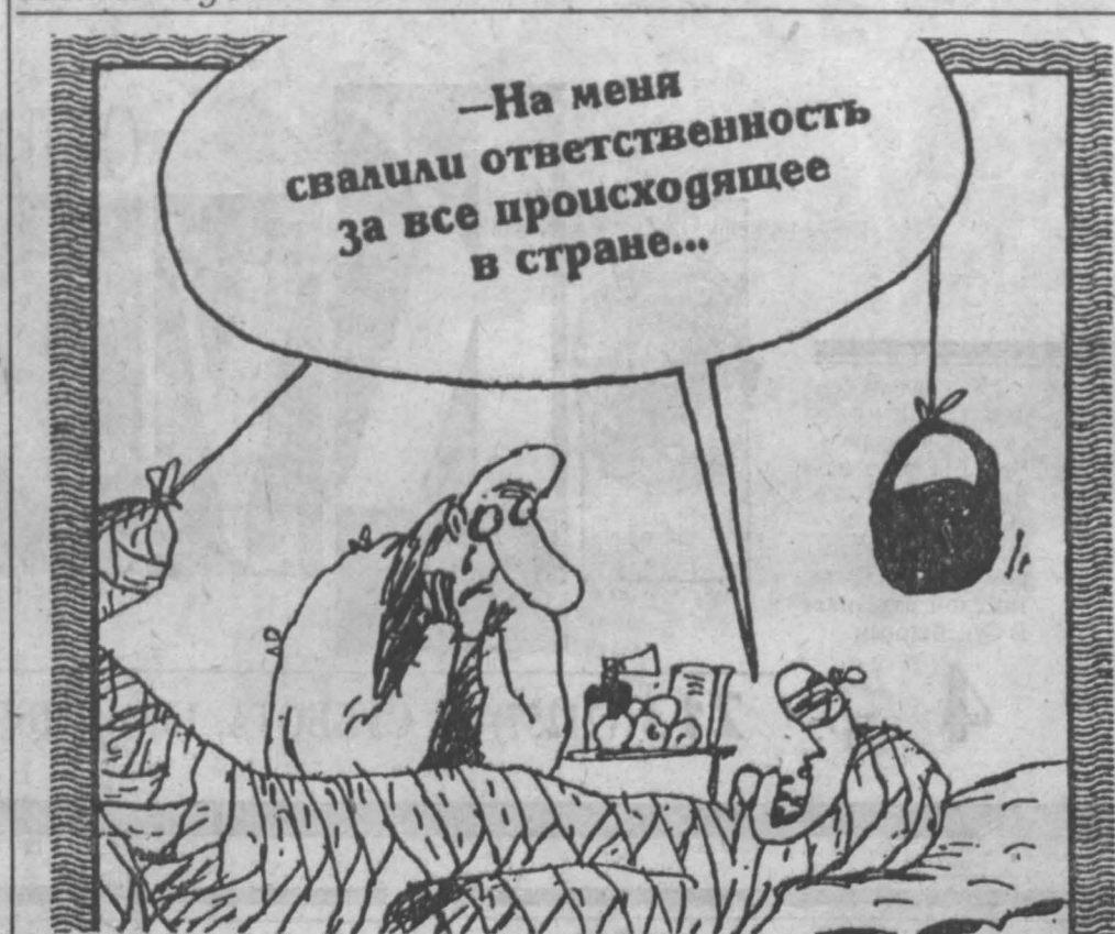
Рис. В. Шилова.