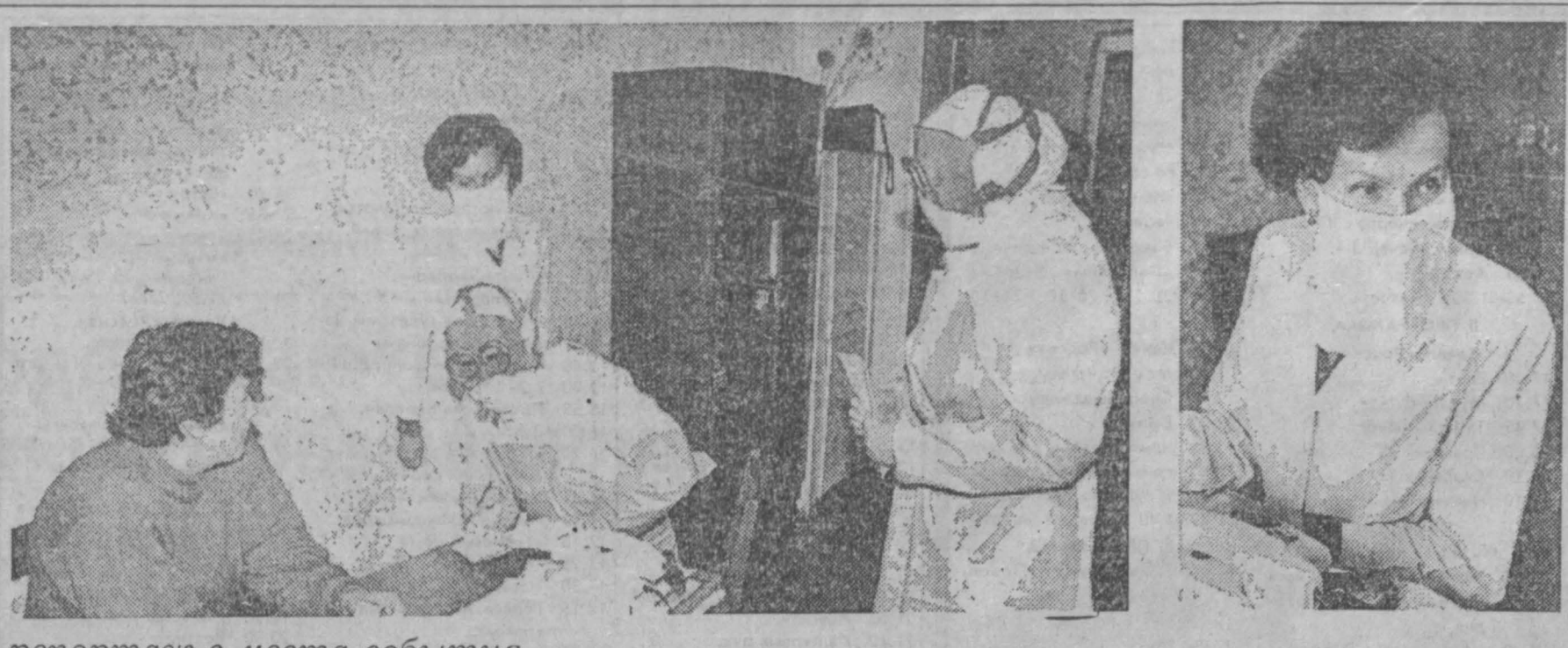
репортаж с места события