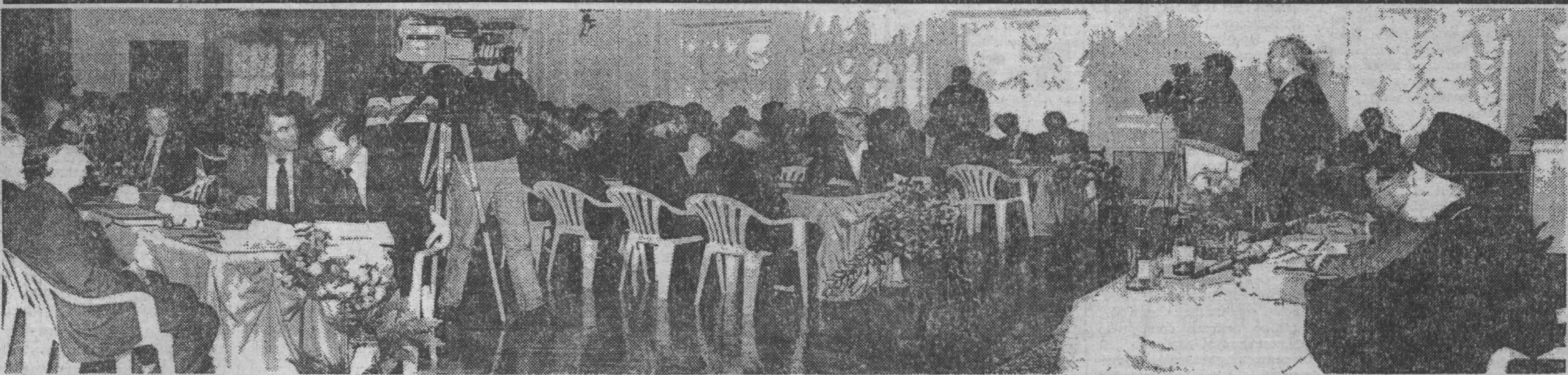
НА СНИМКЕ: во время подписания Договора об общественном согласии.