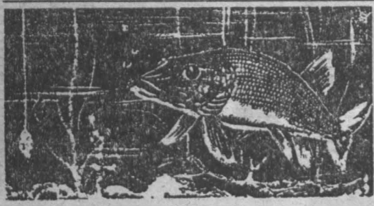
«Блесна его превосходительства» Рис В.Арханова

Сообщаем своим клиентам о поступлении: краскопултов СО-20Б, краскораспылителей КРП-11 (0,4 МПа), КРП-18 (0,2 МПа), пистолетов монтажных ПЦ-84, цепных электропил фирм "ELTOS". Как всегда на складе: "болгарки", электрорубанки, электропилы, перфораторы, электродрели и многое другое. ПКФ "ЭЛЕКТРА" тел. 28-07-43, 28-97-10 пр. Кузнецкий 83 а