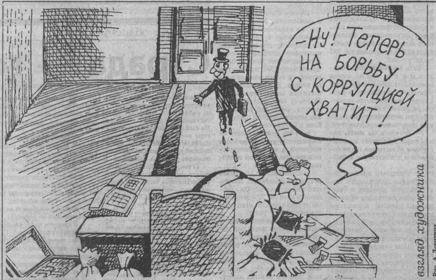
Взгляд художника Рис. А. Леушин

Кинотеатр учитывает возвращающийся интерес зрителей к советскому и российскому кино. Отечественные фильмы составляют основную часть его репертуара. В ближайшее время кинотеатр планирует предложить несколько новых комедий, а также старые киноленты — в связи со столетием кинематографа Режиссеры смогут посмотреть знаменитую сказку «Василиса Прекрасная», веселые мультфильмы в плане кинотеатра — программа к 50-летию Победы, кинолектории, заседания кино клуба.