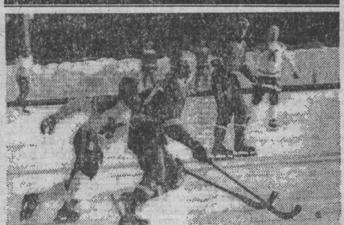
хоккей с мячом

больных не своего профиля — с тяжелыми психическими отклонениями, алкоголиков, наркоманов и т.д. Помощь медицинского психолога и психиатра — разные вещи. Это должны понимать будущие пациенты. И об этом в будущем врачи в бездвушье. Для своих будущих посетителей коллектив центра постарается сделать пребывание здесь и лечение приятной процедурой. Здание центра прекрасно выглядит после ремонта. Здесь уютно и чисто. С учетом специфики работы подобрана цветовая гамма интерьера, довольно комфортно обрешено помещение. Заканчиваются последние приготовления перед открытием. Наверное, в первой декаде сентября оно уже состоится. Т. КОЛОКОЛОВА.