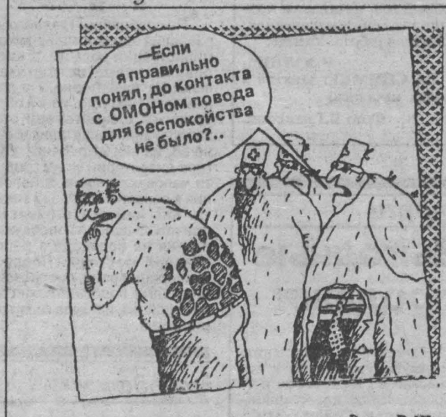
Рис. В. Шилова.