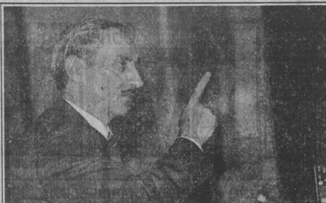
к событиям в Чечне