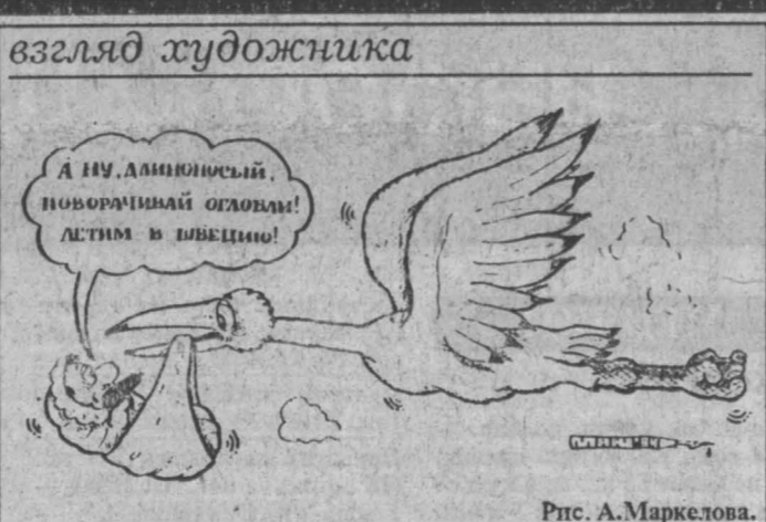
Рис. А. Маркелова.