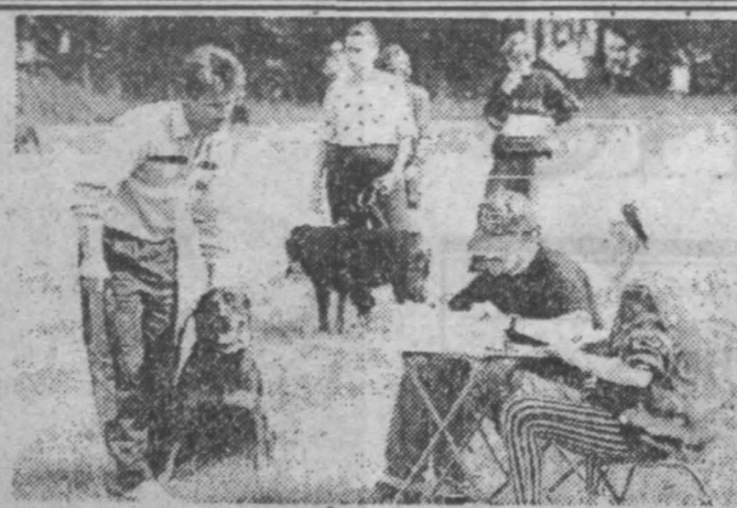
20-21 августа в г. Кемерово состоялся уже традиционный, третий, чемпионат Кузбасса среди собак. И в этом году, как и в прошлом, выставка собак порадовала всех, кто находился на стадионе «Автомобилист», — и участников, и экспертов, и просто зрителей, которых было немало.

В том, что выставка «состоялась», сомневаться не приходится. Постарались организаторы — общество любителей животных «Фитис». Второй год радуется гостеприимство дирекции стадиона «Автомобилист», создавшей все условия для успешного проведения выставки.