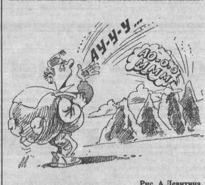
Рис. А. Левитина.

«КОСМОС». Комедия КАРА НЕБЕСНАЯ (12, 15-40, 21). Остроумный боевик ЭЛИТНЫЙ ОТРЯД (14, 19-20). Комедийный детектив СУМАСШЕДШИЙ ЭЗДОК (17-40). «ВРЕМЯ». Один из последних фильмов Бронзона Ли БЕГЛЫЙ ОГОНЬ (13-30). Киножест «Саша» представляет: МЕСТЬ И ЗАКОН, две серии (14-30, 17, 19-30). ЗАВЕШАНИЕ ГОЛУБОГО ДЯДУШКИ (22). Возрастное ограничение 18 лет.