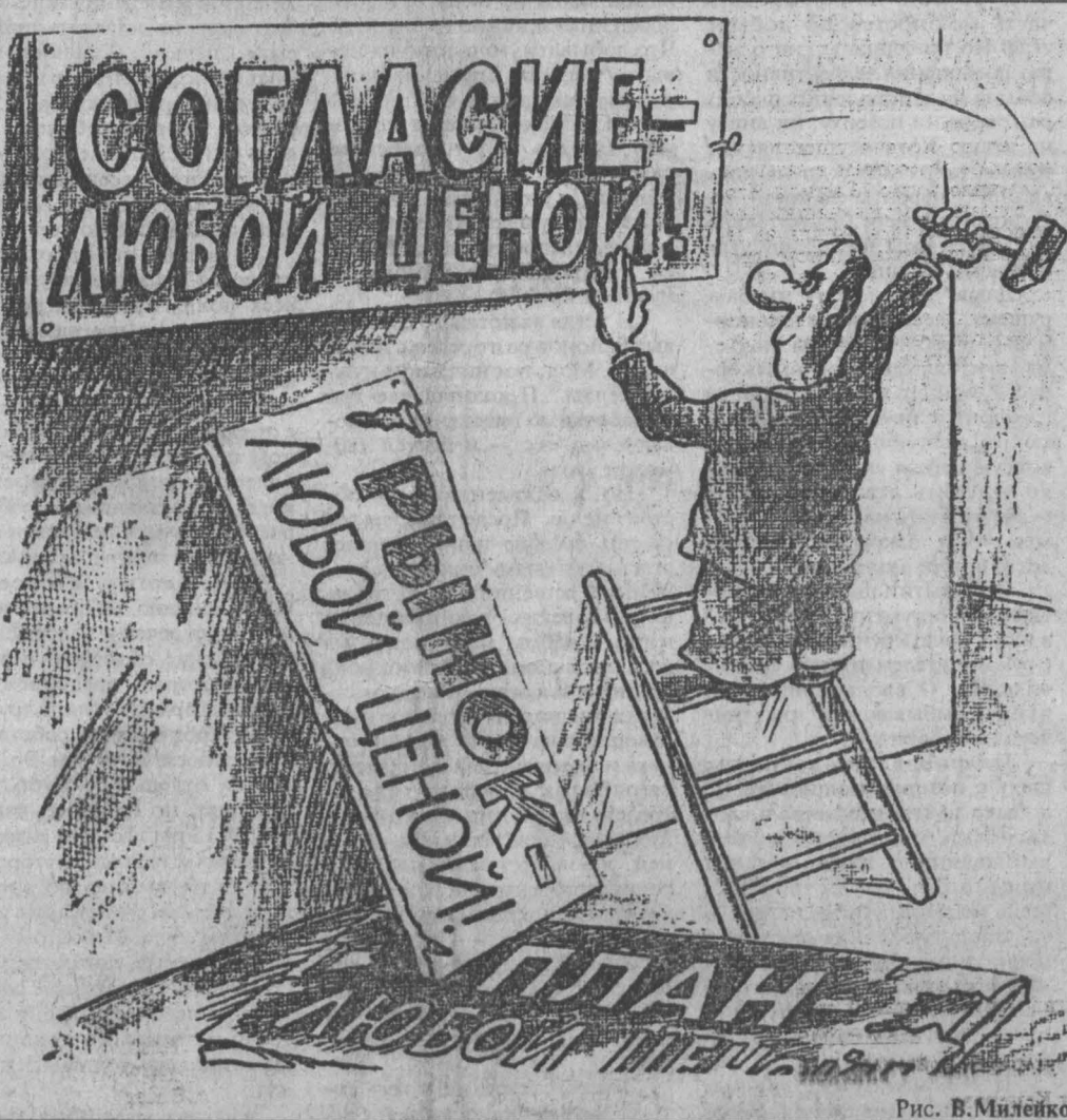
Рис. В. Милейко.