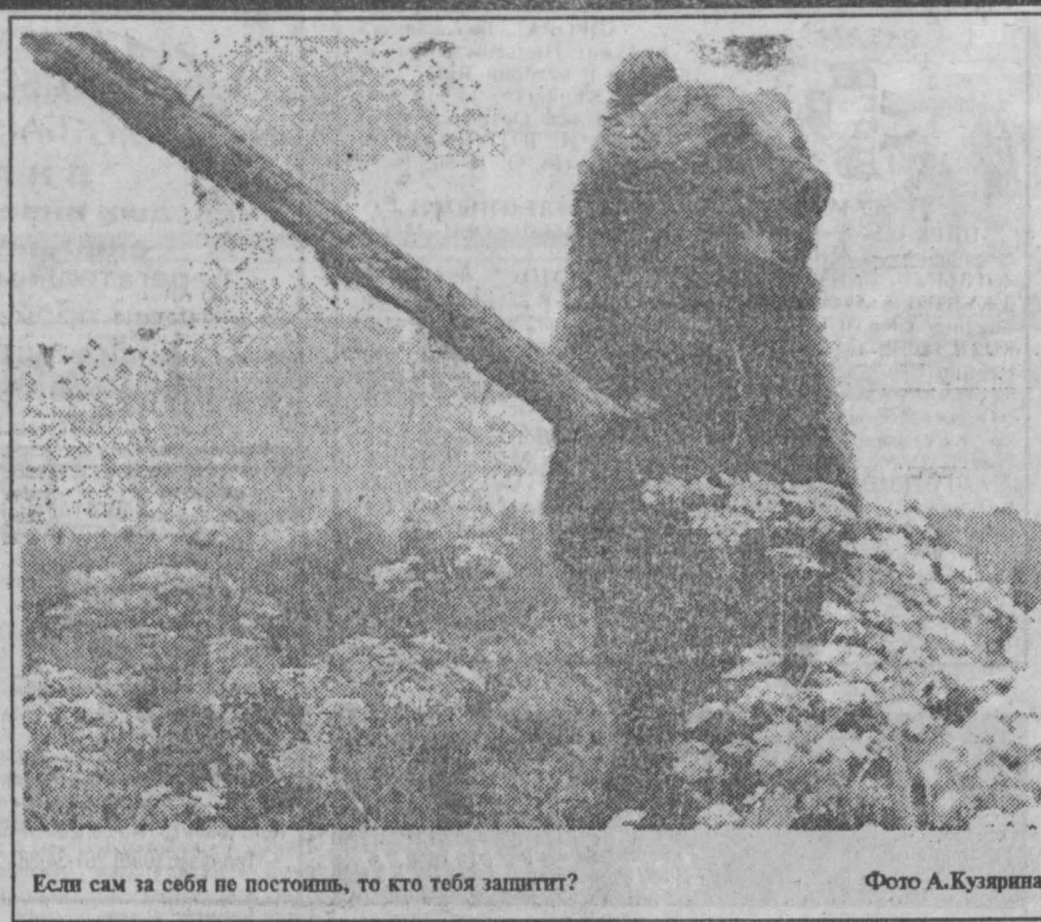
Если сам за себя не постоишь, то кто тебя защитит?