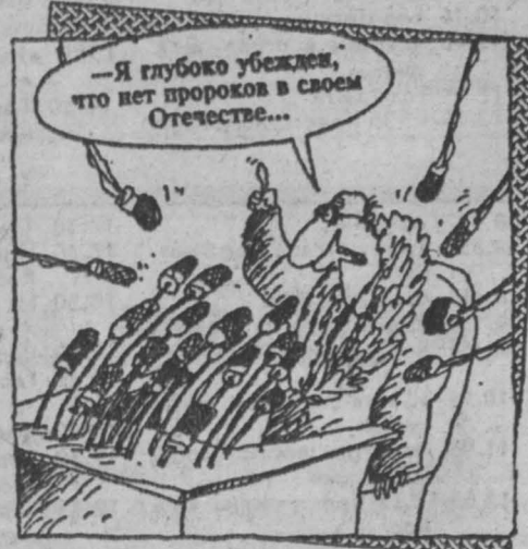
Рис В. Шилова.