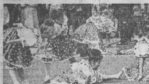
Лето — пора прекрасная. О том, как отдыхают ребятишки, рассказывается в фоторепортаже А.Блотникова.