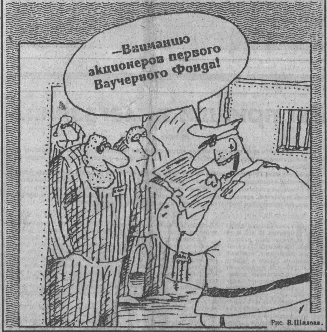
Рис. В. Шилова.