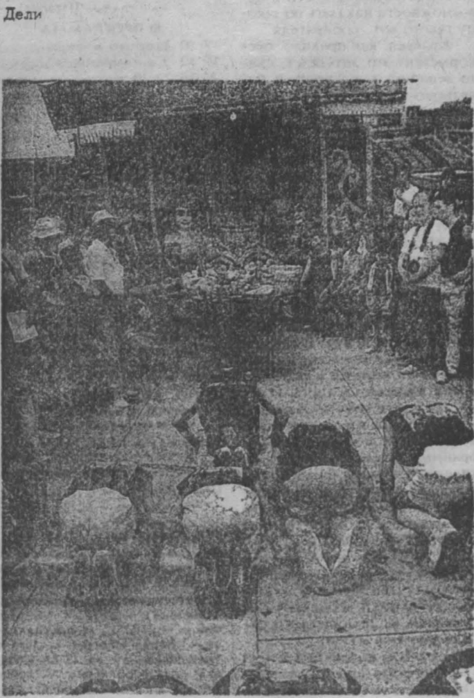
Артисты бродячего кукольного театра мастера Ли Ин-дун (Тайвань) поклоняются китайским божествам — покровителям искусств, призывая их даровать успех в делах и популярность среди зрителей