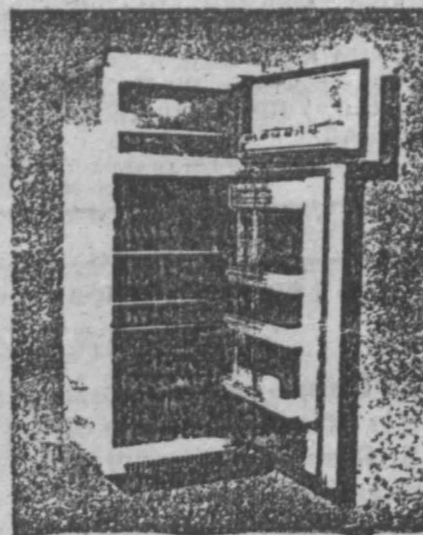
«МИНСК-126-1»: общий объем — 300 л, мороз. камеры — 80.

Предлагаем отдых в Болгарии на черноморском побережье курорта «Солнечный берег». Полный пансион. Полупансион. Завтрак. Чартерный рейс. Форма оплаты любая. Тел. (3842) 25-46-80 в г. Кемерово.