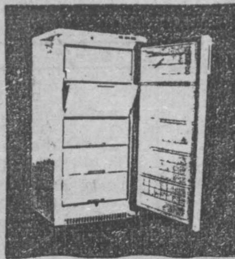
«МИНСК-131»: общ. объем мороз. камеры — 200 л.