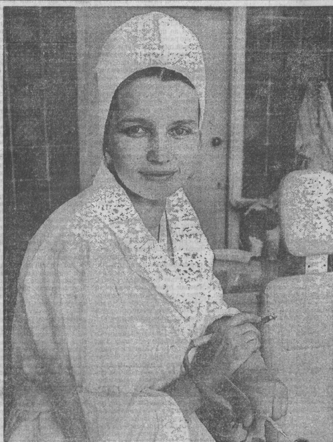
завтра — День медицинских работников

И раньше затоваривались посудой ведущие ее прием торговые точки. Теперь же ликероводочной продукцией, пивом и соком торгуют десятки коммерческих магазинов, а принимает тару только райпо. Пустые бутылки из района отправлялись в основном на Марининский ликеро-водочный завод в обмен на полные. Но задоказав заводу, райпо в январе текущего года пользуется продукцией других изготовителей, зачастую через розовых посредников. А ни пустая тара не нужна. Присутствовавший при моем разговоре один такой посредник откровенно заявил: «Я водку с Северного Кавказа привез, а вывезти туда вагон пустых бутылок — это вылететь в трубу».