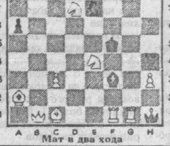
Мат в два хода

Хозяева — волеволазчие — завоевали второе место. Третье — у команды Междуреченска.