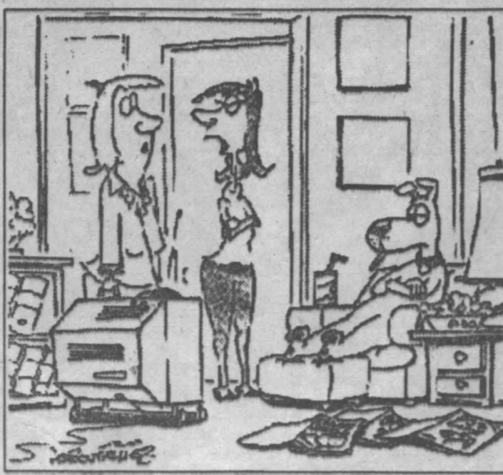
«Гис» гуганса. Мой муж дрессирует нашу собаку.

СОБАКА И ПОДПСКА — Жак, ты так любишь свою собаку, что просто дивишься ей. Почему ты так привязан к ней? — Она приносит каждый день мне газеты. — Это не такое уж необычное дело... — Наверное, ты прав. Но не забывай, что я не подписываюсь ни на одну газету.