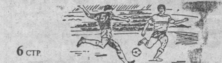
Продолжается чемпионат России по футболу среди команд второй лиги. Кемеровский «Кузбасс» одержал убедительную победу над торпедовцами Рубцовска. Подробности в репортаже «Пропри» в свое удовольствие»