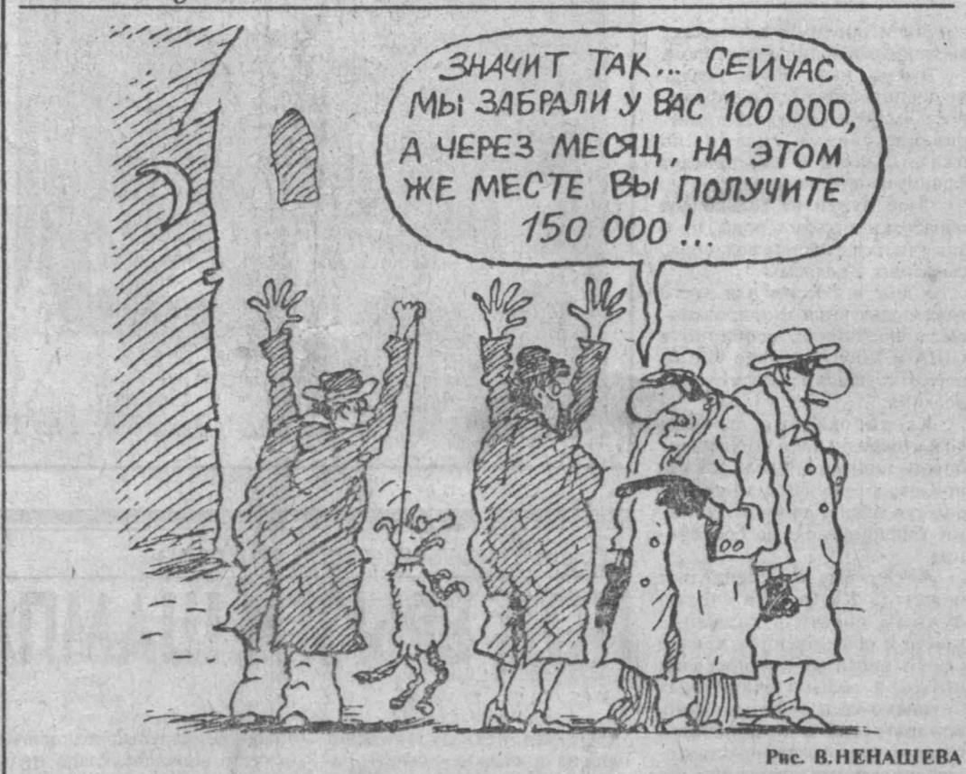
Рис. В. ВЕНАШЕВА