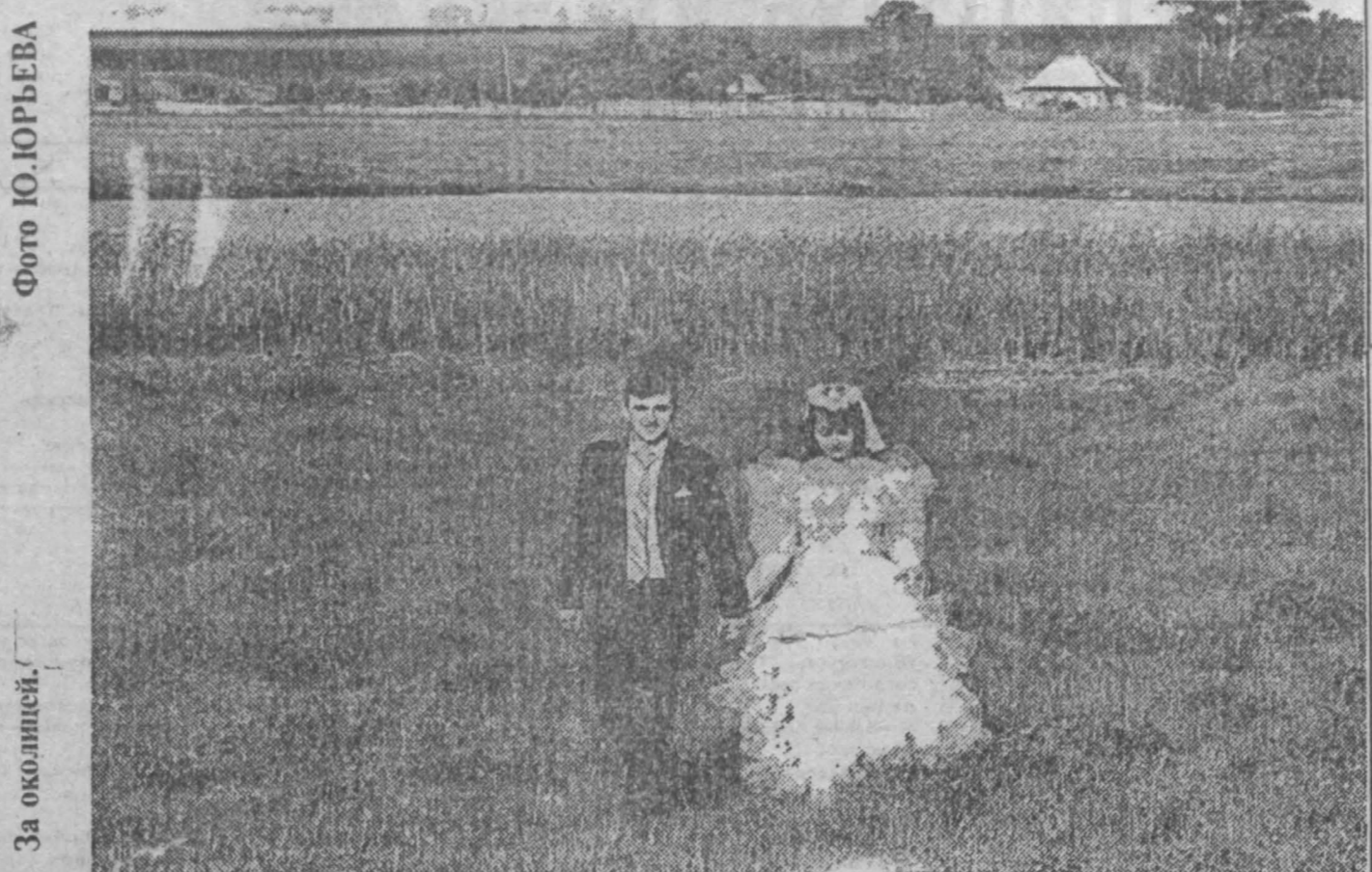
За окнами.

По вопросам качества печати звоните по тел 52-11-44. Иллюстрации и дизайн «Кубасс» — 650404. И Кемерово пр. Октябрьский, 28. Заказ № 124