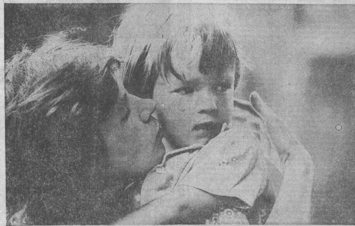
сегодня — Международный день защиты детей

ше раз в год. Уже второй год выполняется программа «Кузбасс — детям». Программой предусмотрено создание сети учреждений нового типа для оказания медицинской, консультативной, психолого-педагогической, социально-бытовой поддержки и помощи детям. Меняется сегодня и школа. В настоящее время, кроме обычных общеобразовательных школ, в области действует пять лицеев, 14 гимназий, открыто 139 школ с углубленным изучением предметов. Посмотрите, какое разнообразие организаций и объединений детей у нас появилось: ассоциация учащихся «Новое поколение», общества «Россия» и «Школа народной культуры», фонд «Юные дарования» и «Молодые таланты Кузбасса». И все они направлены на заботу о развитии ребенка, на приоритет его интересов, уважение его мировоззрений.