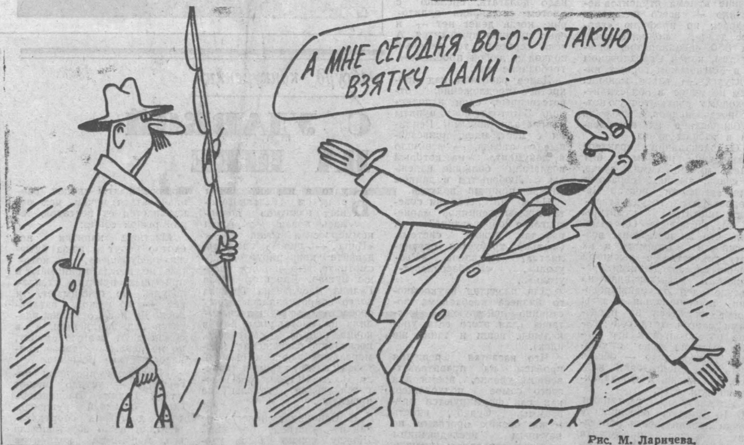
Рис. М. Ларичева.