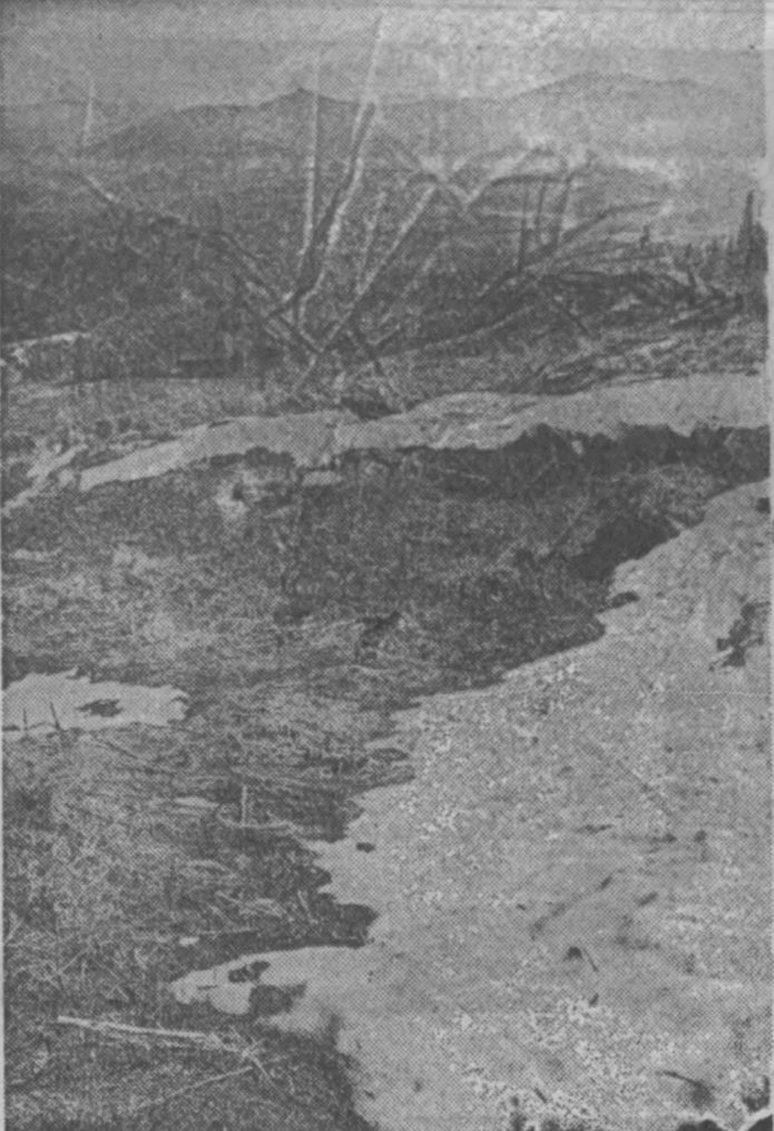
В Горной Шории.

ражает число бросивших курить. В. ОСИНСКИЙ, заведующий кафедрой терапии Кемеровского медицинского института.