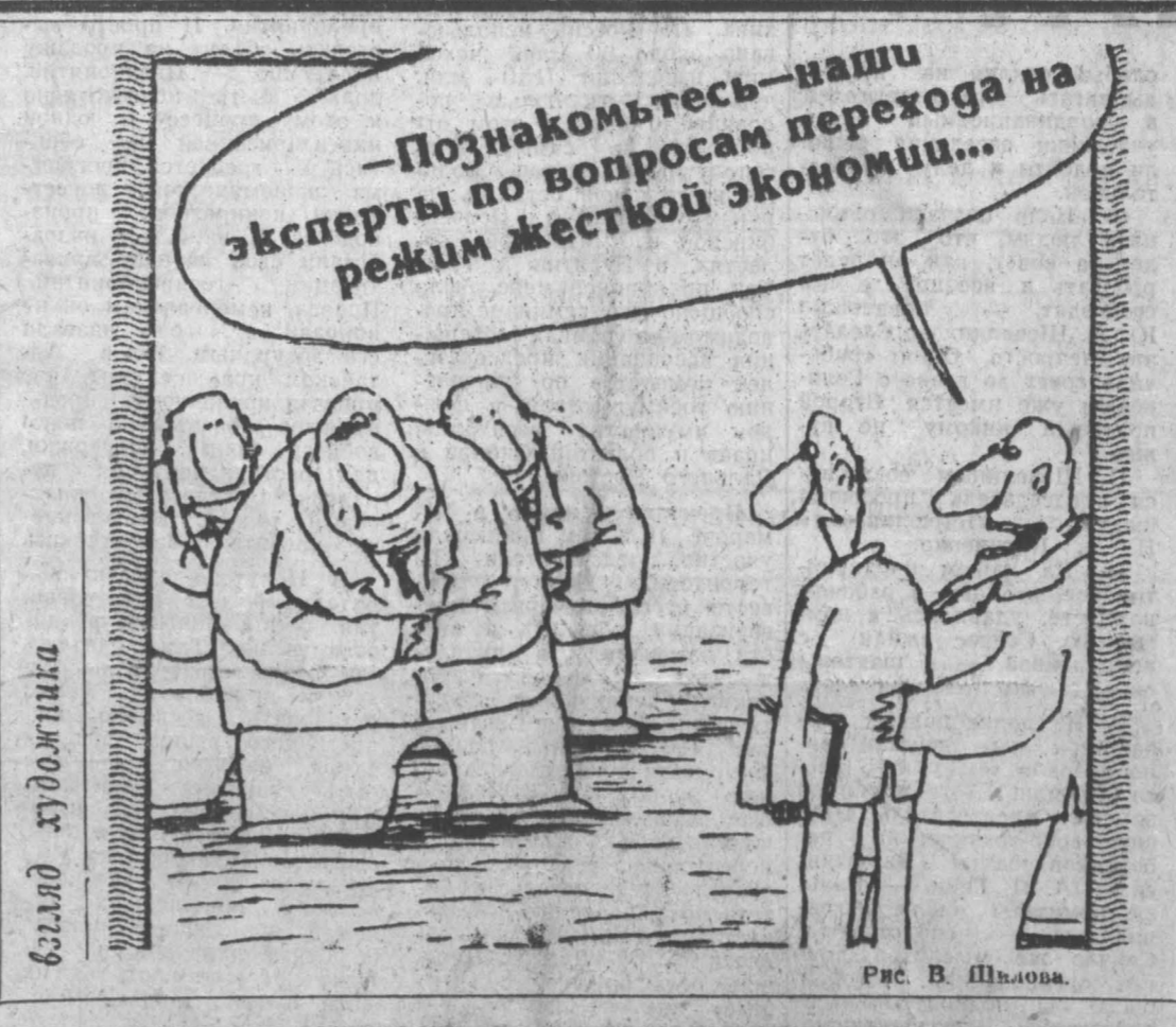
Рис. В. Шилова.

К счастью, на этот раз все отделалось легким испугом. Но детские шалости начинают принимать опасный оборот — мальчишки и девчонки в последнее время испытывают особую тягу к огню. Горят подожженные ими участки сухой травы, деревья, дворы, подвалы, а вот теперь и подъезды.