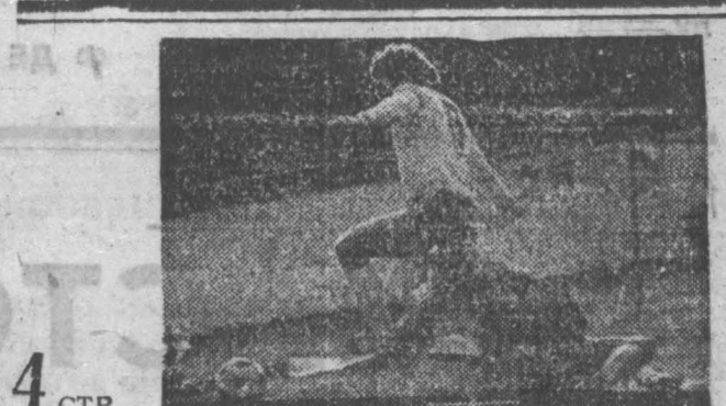
Наконец-то и в Кемерово пришел большой футбол: в субботнем матче «Кузбасс» принимает «Иртыш» из Тобольска. Стратию футбольного сезона посвящается сегодня подборка материалов.