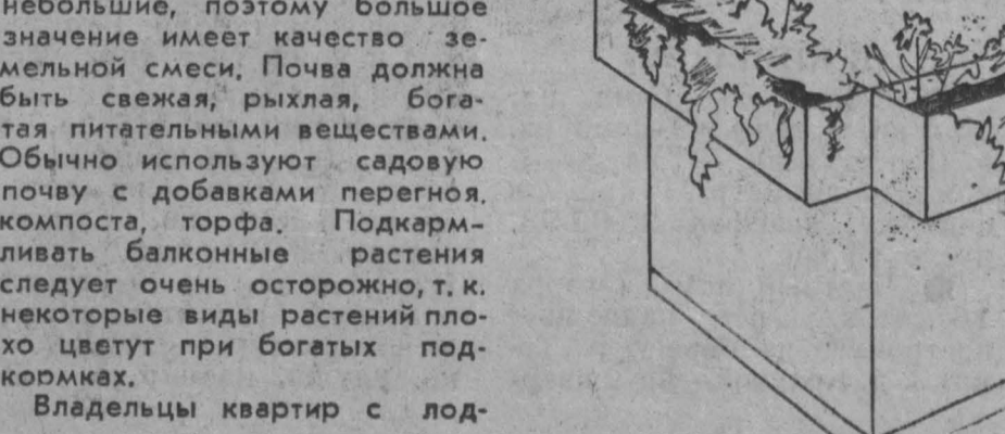
Рис. В. Архипова.

Мы рассказали только о самых общих принципах разведения мини-сада на балконе. Интересующиеся проблемой глубже могут почитать свои журналы.