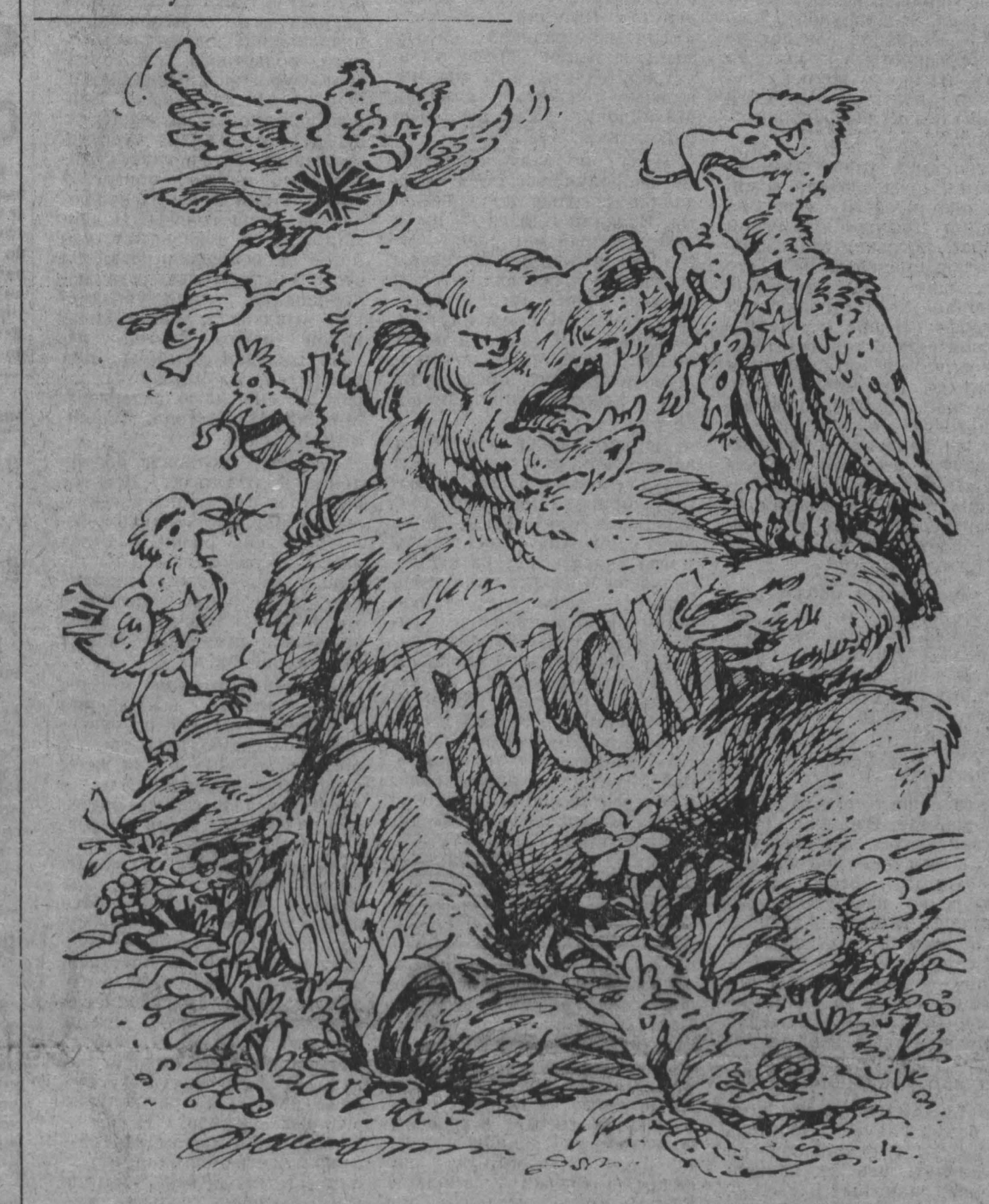
Рис. М. Жилина.