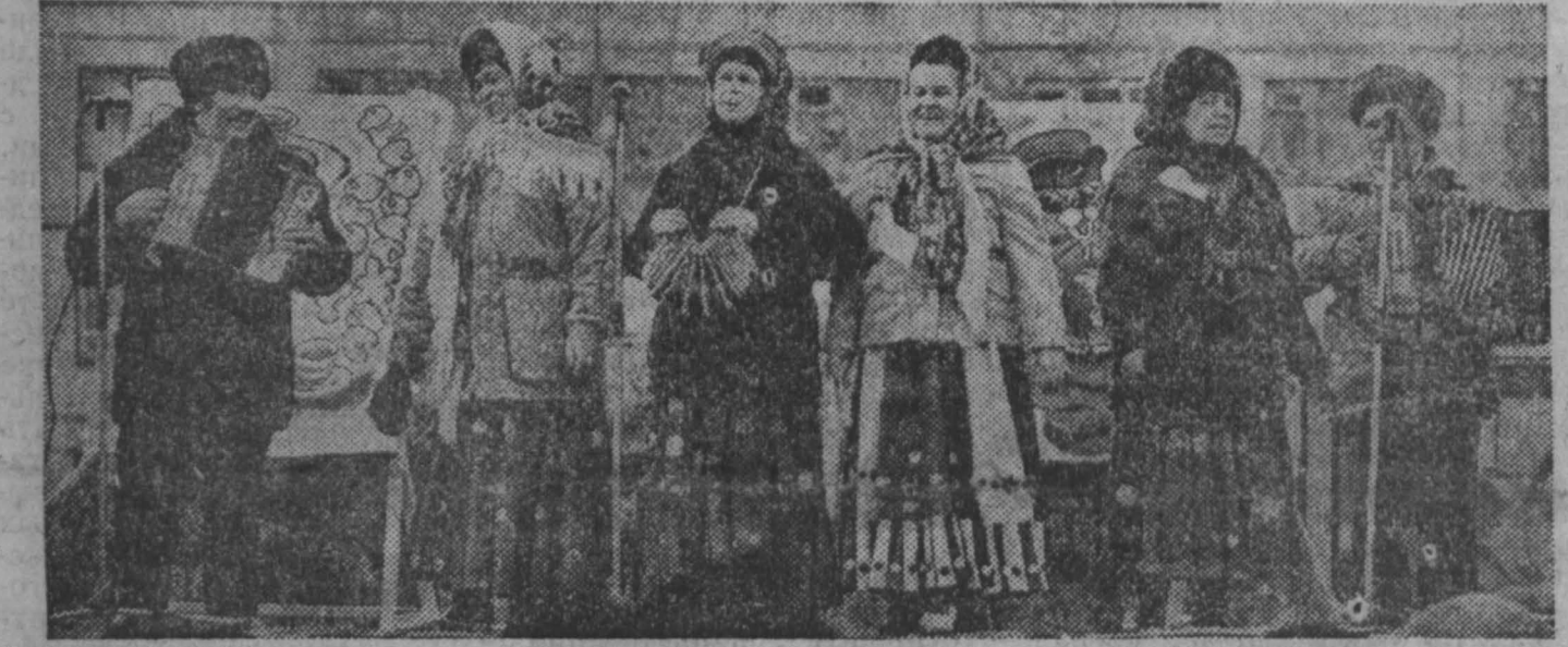
г. Кемерово.