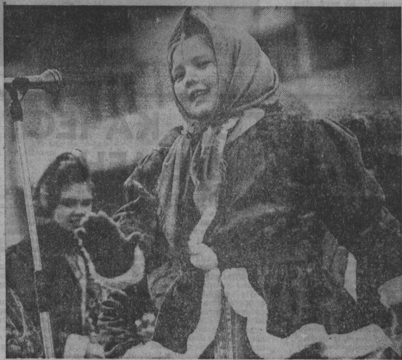
В городах и селах Кузбасса с самого начала месяца прозвучат ставшие уже традиционным праздником «Проводы русской зимы». С шутками, народными танцами и песнями, спортивными состязаниями и лезаньем по столбам встретили весну в минувшие выходные дни жители областного центра.