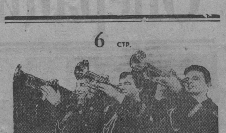
Запели трубы. Под своды зала ворвалась радостная, светлая музыка. Так начался во Дворце культуры гварзема «Идеовина» вечер, посвященный 10-летию оркестра «Геликс». Об этом коллективе, о творческих делах горячего Дворца мы рассказываем сегодня.