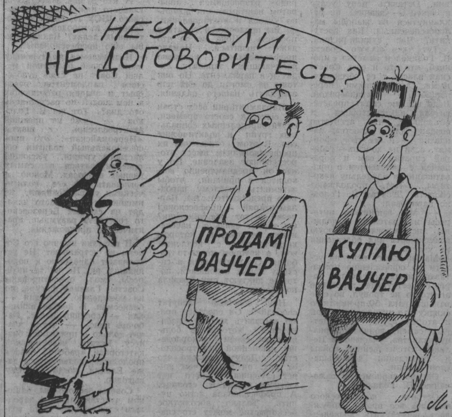
Рис. М. Ларичева.