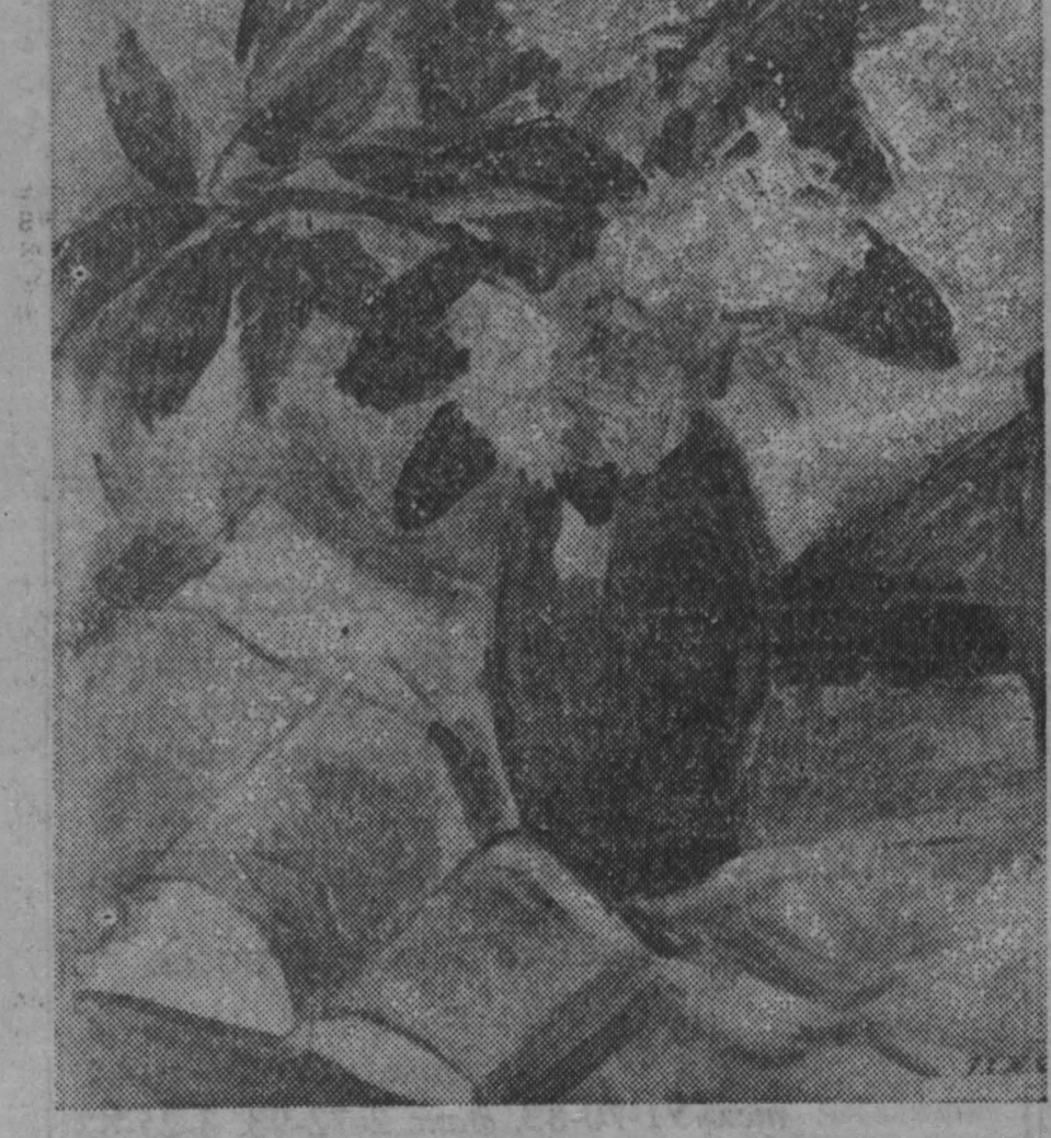
Ю. И. Преисс. «Рододендрон». Н. И. Бачинин. «Портрет ленинградки»

Сообщил, что привезли два мультфильма «Ну, погоди!»