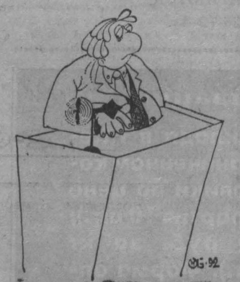
Рис. Н. Астраханцева.

Вы закладываете в цену своей продукции 500-процентные общезаводские расходы и 415-процентные расходы (письма на Кемеровскую ТЭЦ от 30.12.92 г. и от 1.01.93 г.). Ваши цены на продукцию не контролирует ни один орган, кроме рынка.