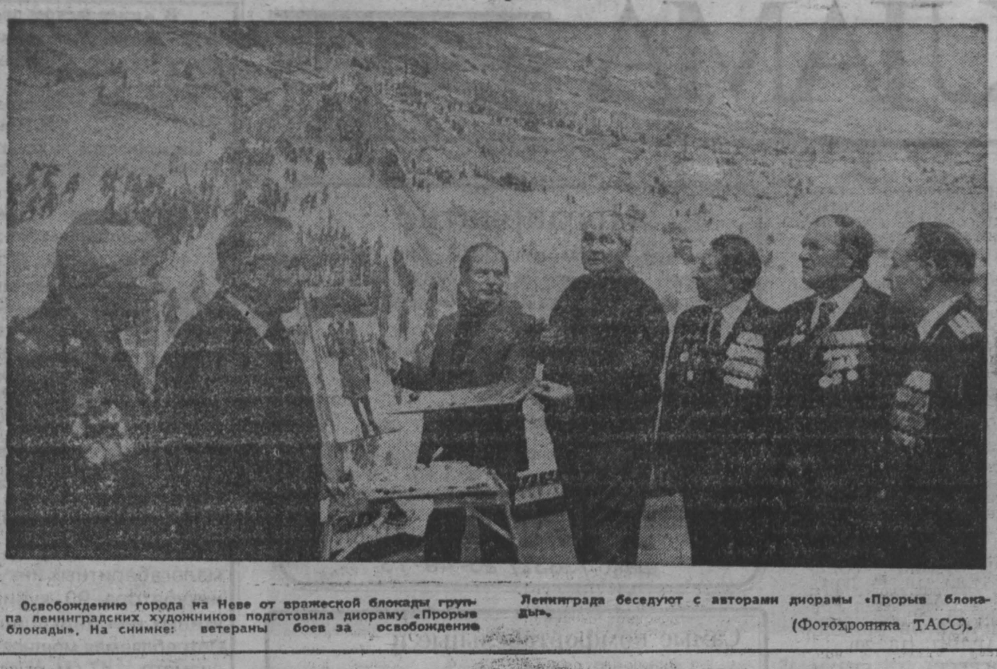
Освобождению города на Неве от вражеской блокады группа ленинградских художников подготавливает диораму «Прорыв блокады». На снимке: ветераны боя за освобождение Ленинграда беседуют с авторами диорамы «Прорыв блокады».