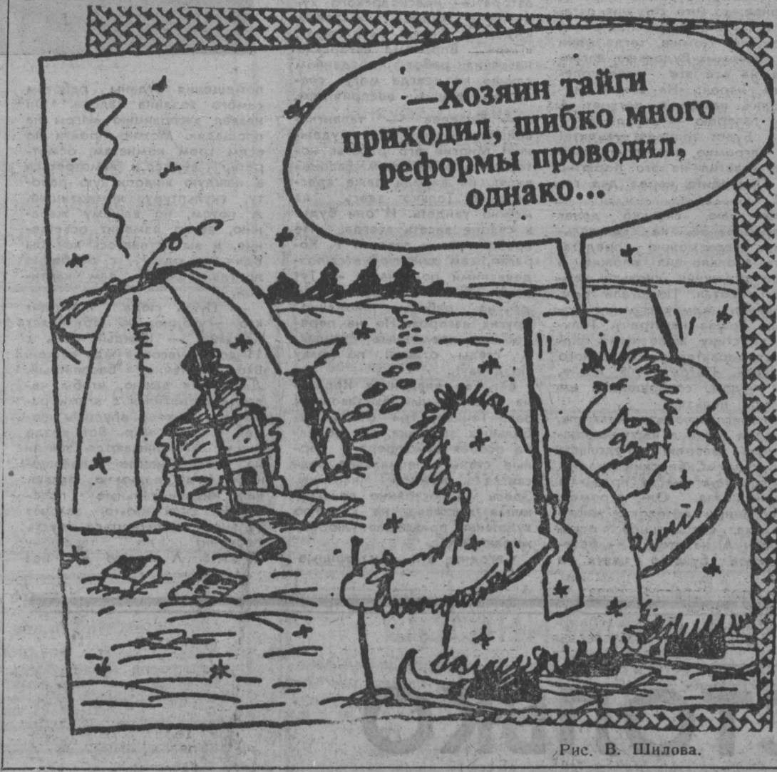
Рис. В. Шишова.