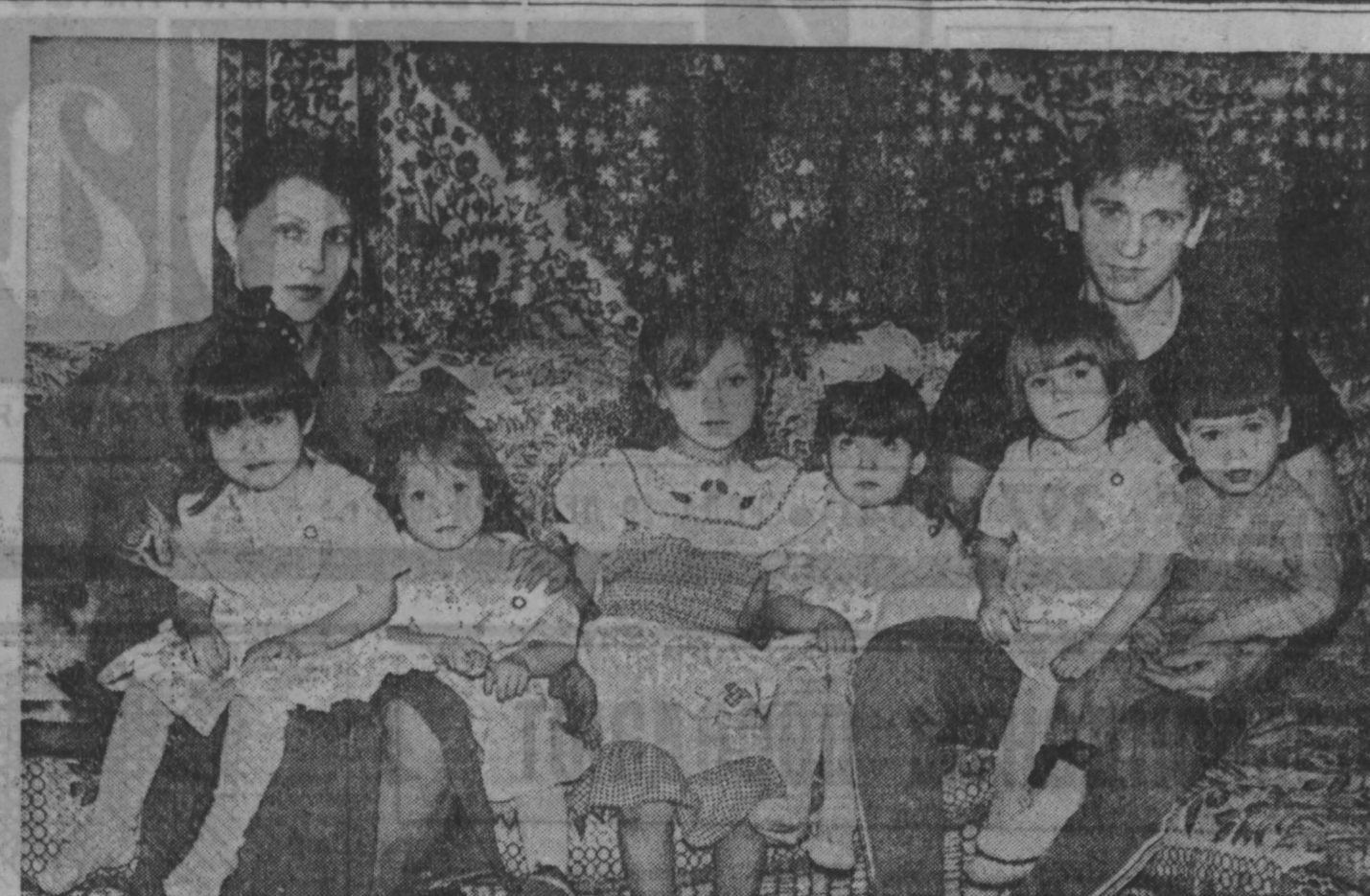
Вот это семья!

Вобщем, на 94-й год мы намечали обеспечить льготные категории населения, нуждающиеся в жилье, на уровне 25—30 процентов от общей площади, планируемой к вводу в эксплуатацию. Даже если нам это удастся, все равно надо иметь в виду: дальнейшая перспектива такова, что строительство указанной категории жилья будет постепенно уменьшаться и уменьшаться.