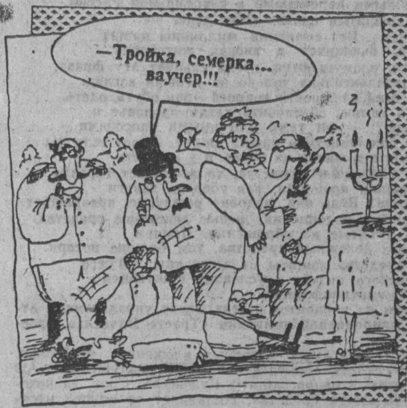
Рис. В. Шилова.

Десять раз нужно посмотреть на свой ваучер, прежде чем сказать самому себе: «Я не верю в свое предприятие, я не вкладываюсь в него».