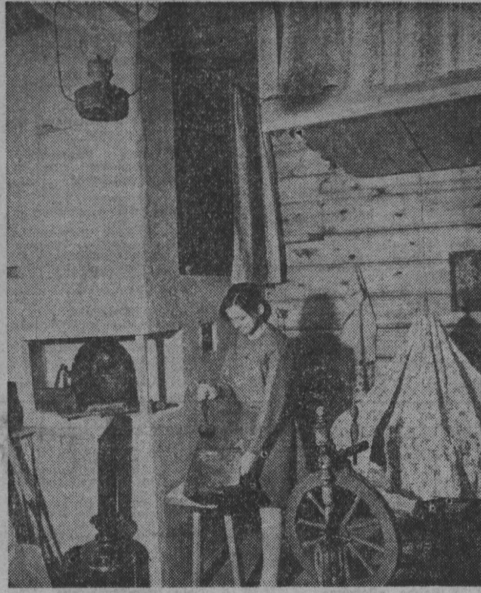
Старший научный сотрудник Кемеровского краеведческого музея.

Даже беглого знакомства с Промышленновским музеем достаточно, чтобы сделать вывод о его жизнеспособности.