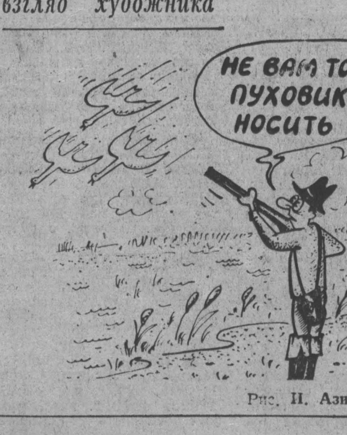
Рис. П. Азимова.