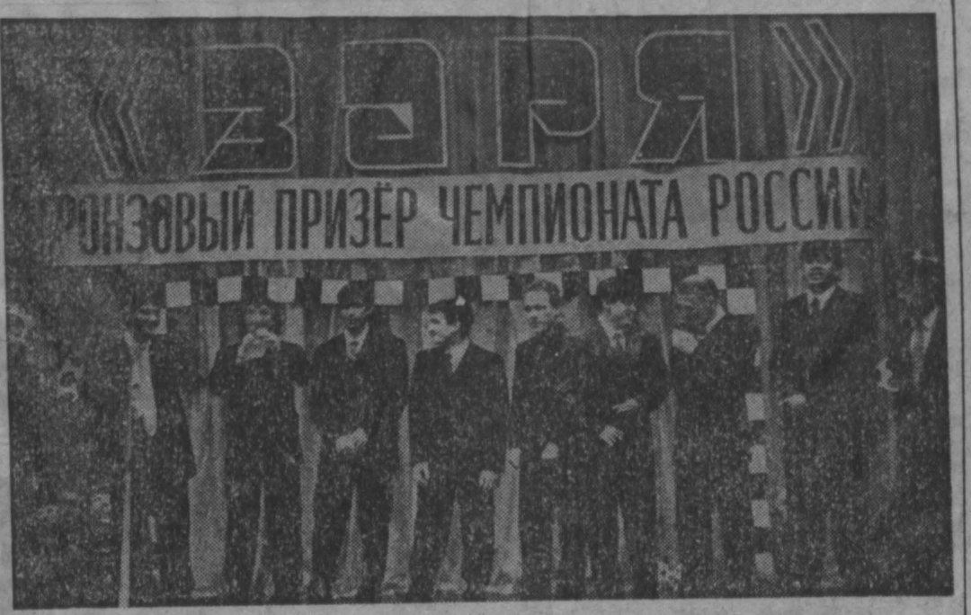
Бронзовый призёр чемпионата России АСП «Ленинск-Кузнецкий» берёт команду на полное содержание...

«Заря» — команда горняков. И угольным предприятием города на только морально, но и материально поддерживают футболистов.