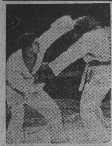
6 СТ. На снимке вы видите фрагмент подиума открытого чемпионата Кузбасса по каратэ, который состоялся в Кемерове. В нем приняли участие около 30 спортсменов области и Алтайского края.

ПЯТЬ РАЗ В НЕДЕЛЮ (индекс 31901) вместе с ерепутами связи: 1 мес. — 550 руб.; 3 мес. — 1650 руб.; 6 мес. — 3300 руб. ТРИ РАЗА В НЕДЕЛЮ (индекс 31029): 1 мес. — 350 руб.; 3 мес. — 1050 руб.; 6 мес. — 2100 руб. ОДИН РАЗ В НЕДЕЛЮ (индекс 31023): 1 мес. — 150 руб.; 3 мес. — 450 руб.; 6 мес. — 900 руб. Внимание! Какой бы вы ни избрали вариант, обязательно будете получать номер с программой телевидения. Читатели, выплавившие пиларовский «Кузбасс», доподлинно станут получать еженедельное рекламное приложение «Панорама». ВЫПИСЫВАЙТЕ, ЧИТАЙТЕ!