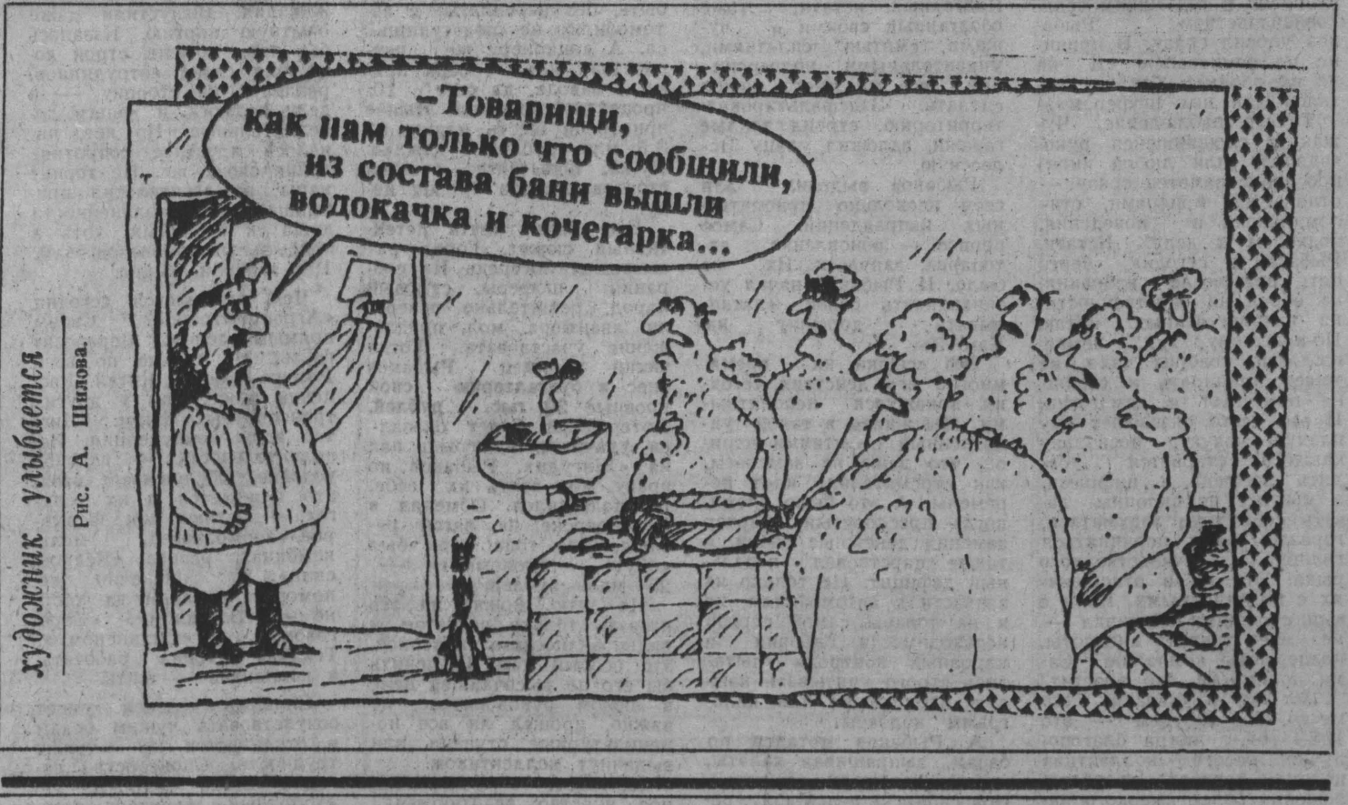
художник убаюкает Рис. А. Шилова.

Если я вас правильно понял, вы будете голосовать против проекта? — У этого не сказал. Не хочу никому навязывать свое мнение. Уверен, что в обществе есть иные точки зрения, и пусть каждый примет решение абсолютно самостоятельно.