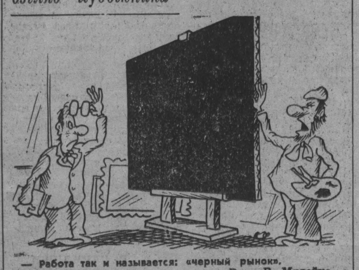
Работа так и называется: черный рынок. Рис. В. Милейко.