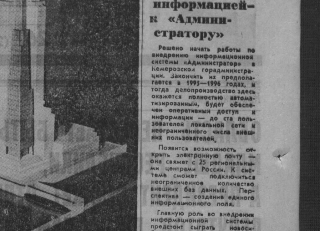
САНКТ-ПЕТЕРБУРГ. Здесь началось сооружение первого в России 150-метрового небоскреба. Проектирование ведут специалисты ЛенНИИпроект и английской фирмы «Вильсон Менсон Инженеринг», а строить — в течение двадцати двух лет — будет корпорация «Двадцатый трест». С этой целью создается специальный фонд, выпускаются акции. Так что познание — увидим. НА СНИМКАХ: проект первого российского небоскреба