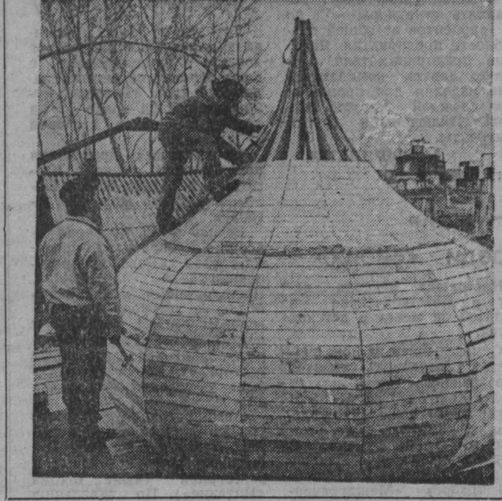
г. Юрга.

НА СНИМКАХ: строящийся храм; скоро будет готов третий купол.