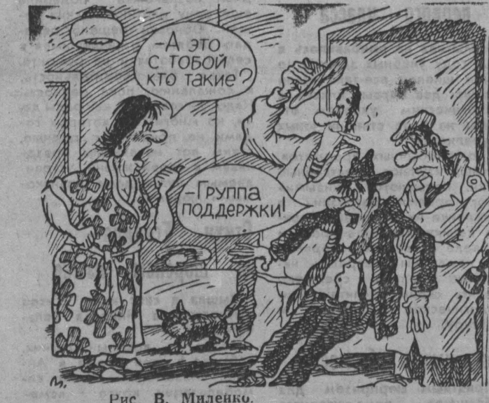
Рис. В. Миленько.