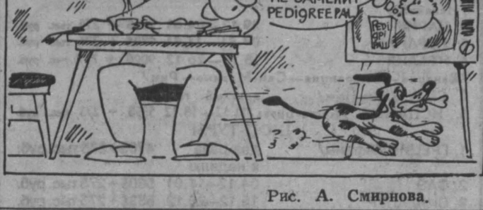
Рис. А. Смирнова.