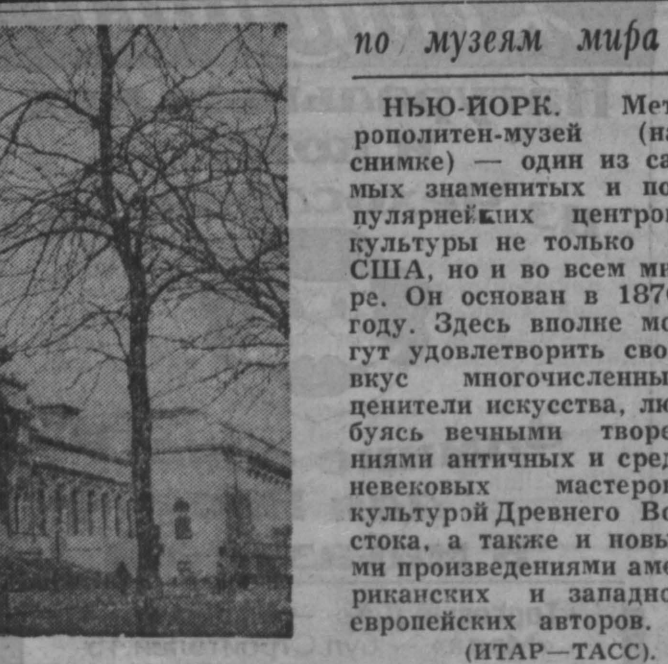
по музеям мира

Одним карманом четверть миллиарда сэкономленных марок, государство выигрывает на оплату пособий до 80 процентов этой суммы. Общественность волнует и вопрос о том, не ослабнет ли в результате армейского отпуска обороноспособность страны? Военное руководство считает, что нет. Тем не менее уверенность военных, видимо, не сняла опасения общественности. В этой же «Хельсинки самодат», например, помещена карикатура. На ней изображен КПП военной части, а на шлагбауме плакат: «Уважаемый агрессор! Мы в отпуске, приходите, пожалуйста, через месяц...» Е. ЖЕЛЕЗНОВ, Р. ХИЛТУНЕН, РИА «Новости».