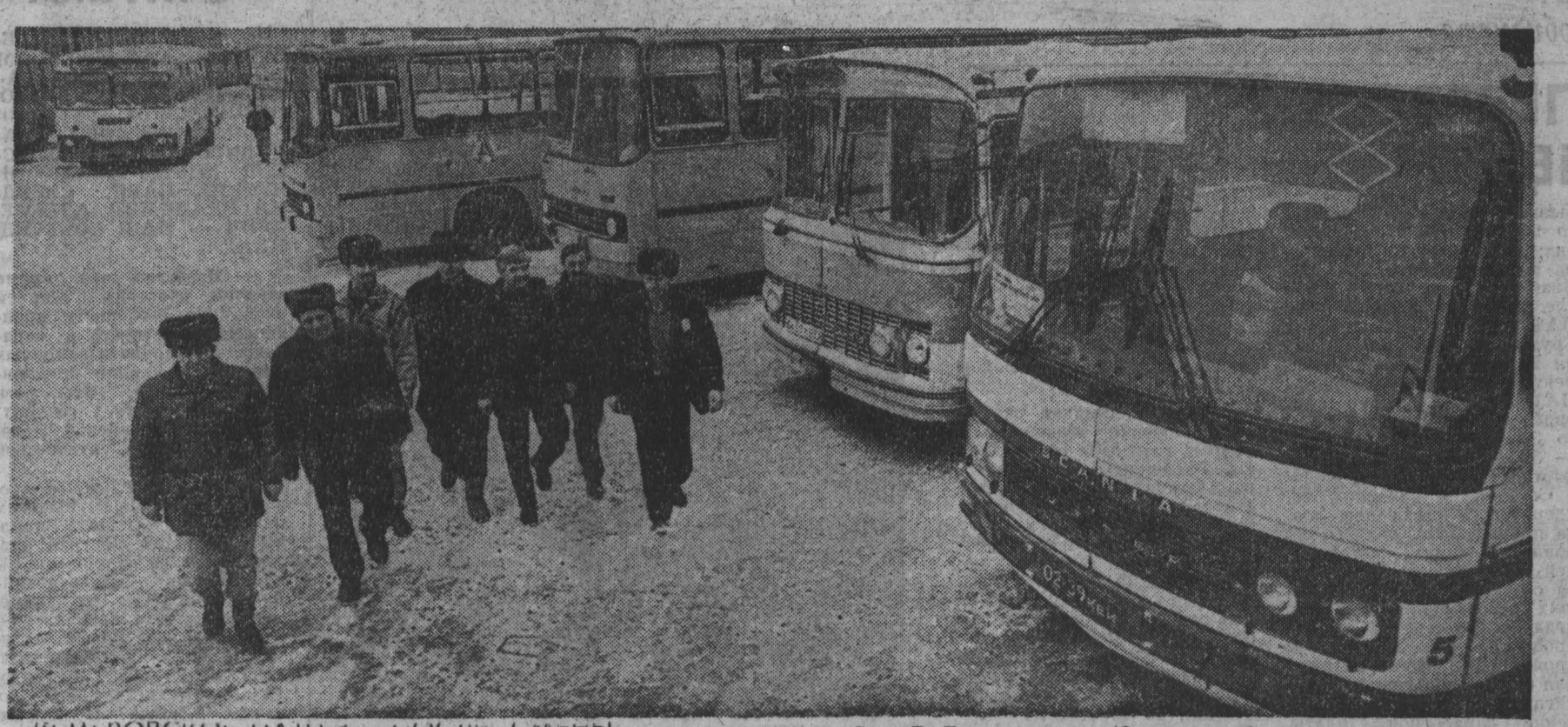
КЕМЕРОВСКОЕ НАПЗ. ПОСЛЕ СМЕРИ. (Окончание фоторепортажа на 2-й стр.)