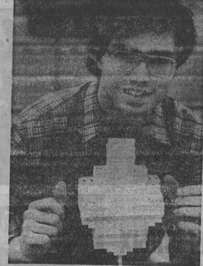
Первый испытательный полет прошел по незапланированному маршруту по Ла-Маншу...