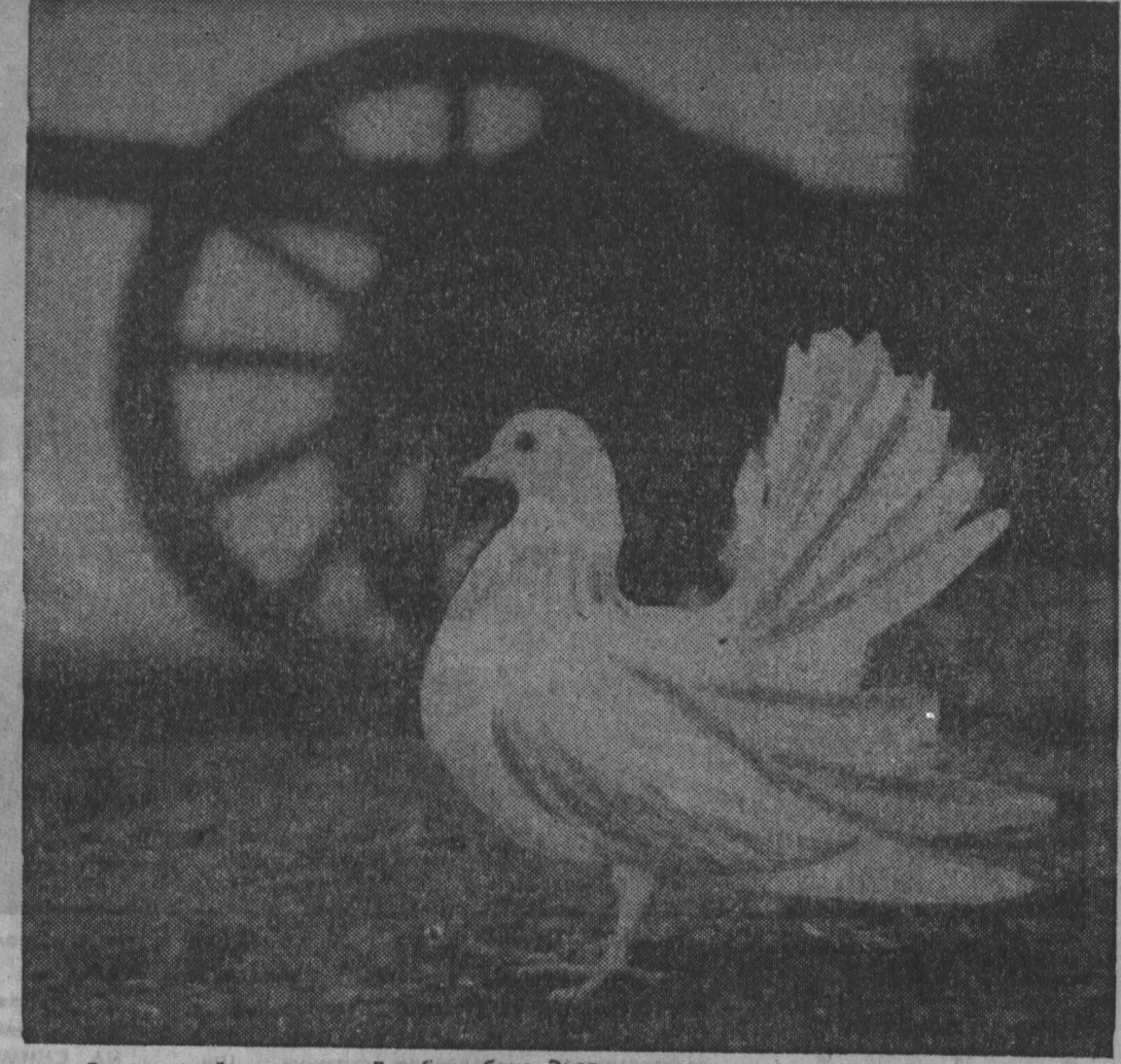
В старинной крепости Варбург близ Эиснаха (Германия).