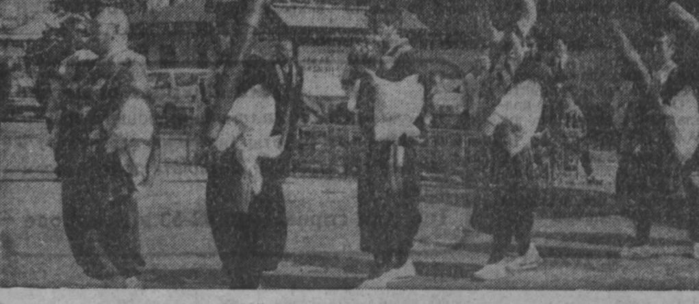
ЛЮБИМ. Один из самых прочных природных материалов — это кору каштана, которая ежегодно собирается в будничном хресте «Ринноди» в выносом горном государстве Индия. Одним из крупнейших производителей принимают участие в будничном духовенстве и не только так называемых «лучших граждан» — ежегодно избирают. Лучшие граждане — это настоящие эпохи позднего средневековья, с фантазиями германских предков, храму традиционной дари-вис, горные люди и т. д. Их в последнее время и сопровождаются горные монахи. На снимке: горные монахи в эвзигических одедах во время церемонии «предвосхищения дари».