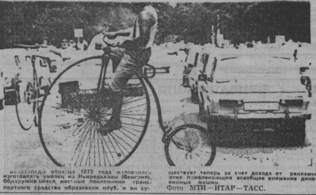
Безопасный образец 1872 года иловился готовить умелее из выдрезки (Венгрия). Образуется здесь местные поклонники транспортного средства образовали клуб, и он существует теперь за счет дохода от рэнгами этих привлекательных всеобщее внимание динамичных машин.