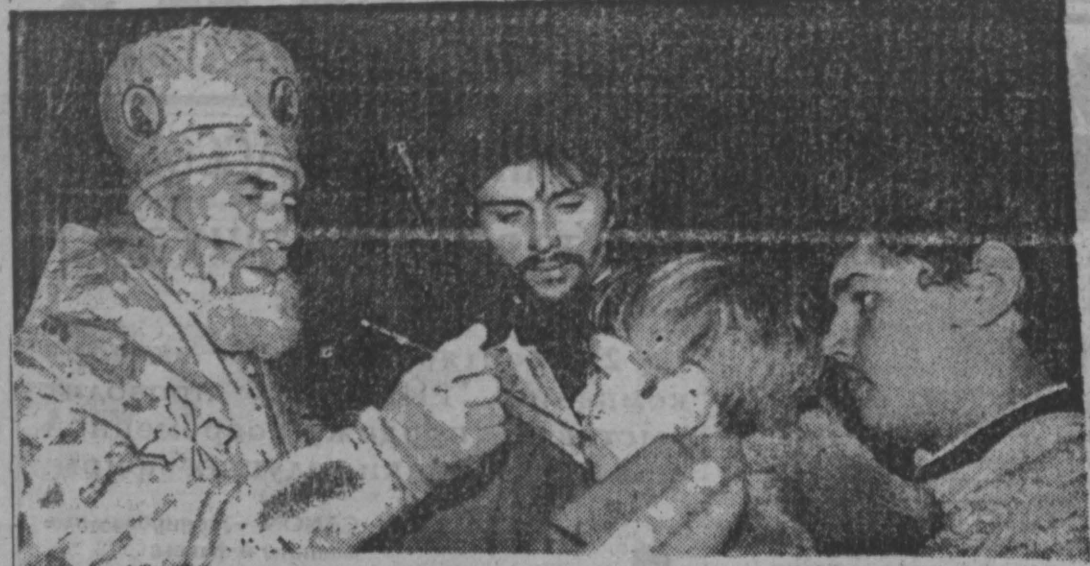
21 сентября (8 сентября по старому стилю) православная церковь отмечает Рождество Богородицы. В храмах области прошли торжественные богослужения, посвященные памяти Преподобной хаданты перед Богом за весь мир. В Георгиевском храме Знаменского прихода службу вел епископ Кемеровский и Новокузнецкий Софроний.