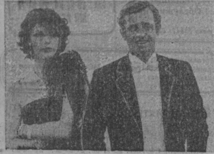
Вовсе не хотел шокировать критику известный французский актер Жан-Поль Бельмондо, отказавшись получить один из самых престижных кинематографических призов Франции — «Сезар», присужденный за лучшую актерскую работу года. Этим поступком он подтвердил свою пресловутую позицию убежденного противника наград. О встрече с актером в нашей стране рассказывает журнал «Эхо планеты».

ЕвроАзия-ТВ — это еженедельная полоса, в которой только в газете «Кузбасс» вас ждут встречи с интересными людьми, печатается программа телепередач АИК-ЕвроАзия-информ, даются анонсы наиболее популярных музыкальных шоу, художественных, документальных, мультипликационных фильмов. Здесь вы можете разместить свою рекламу и объявления, по нашему желанию они будут показаны по телевидению. Читайте спецвыпуск «ЕвроАзия-ТВ»! Наши телефоны: 26-37-74, 26-02-12 факс: 23-40-04.