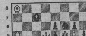
Мат в два хода.

1. e4 e5 2. Kf3 Kc6 3. Cb5 a6 4. Cc4 Kf6 5. 0-0 Cc7 6. Le1 b5 7. Cb3 0-0 8. a4 b4 9. d3 d6 10. e5 Ce6 11. Kh2 Lh8 12. Ce4 Ce8 13. Cf1 Le8 14. Ke3 Kd4 15. Kd4 ed 16. Kd5 Kd5 17. ed Cd7 18. Cd2 Cf6 19. Le8 Ce8 20. Fe2 Cb5 21. Le1 Ce4 22. de h6 23. b3 e4 24. Cf4 Фg7 25. h3 Ld8 26. Fe4 h5 27. Le2 g6 28. Фf3 Cg7 29. Le4 Cf8 30. Fe2 Fe7 31. Cg5 Le8 e2 32. g4 h6 33. Cf6 g4 34. Фg4 Le8 35. Фf3 Cg7 36. Cg7 Kp7 37. Lh4 Le8 38. Lh7 Kp8 39. Фg4 Kp8. И в этом положении черные просрочили время.