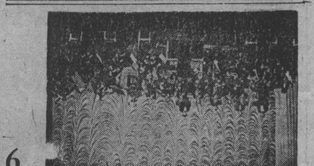
Блиставшие завершились гастроли симфонического оркестра Кубасса за рубежом. Подробным рассказом об этом мы заканчиваем публикацию заметок И. Ляхова, которые назывались «Второй прощанье».

219 (20963) • СУББОТА, 18 СЕНТЯБРЯ 1993 г.