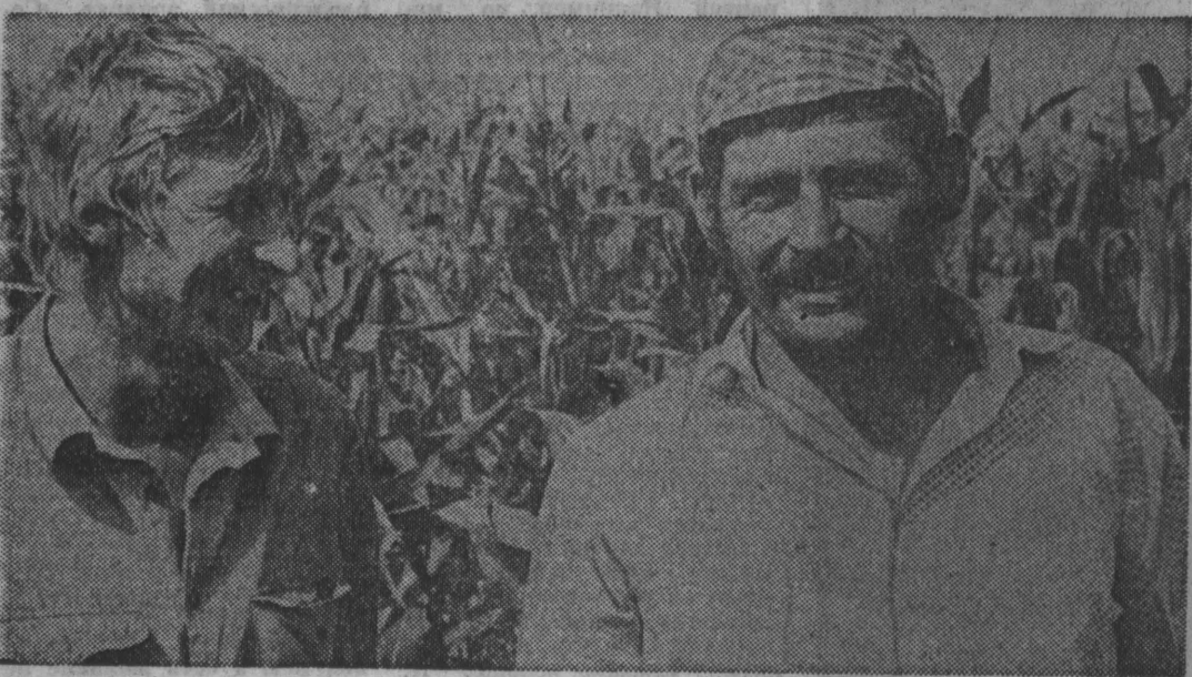
По расчетам совхоза «Симбирский» необходимо вынуждено заготовить 7,5 тысячи тонн силоса. Это помимо других сочных и грубых кормов. Мелкая, скажем, задача для полевых и механизаторов хозяйства, но те 3200 голов крупного рогатого скота, из которых 1100 голов дойного стада, долгой зимой нужно будет кормить дважды в день и по полному рациону. Иначе не будет привеса, не будет молока, а значит, закрывает экономический и сам совхоз.

Уже несколько дней в производственном объединении «Юргинский машиностроительный завод» бастует мартовский цех № 50. Причина, побудившая металлургов на иррациональный шаг — задержка зарплат. Она не выдана им за июль, ни за август. На собраниях металлурги потребовали провести конференцию трудового коллектива, на которую вынести вопрос о компетенции руководства объединения «Юрмаш», о работе совета трудового коллектива и профкома, по их мнению, не защищающих интересы рабочих.