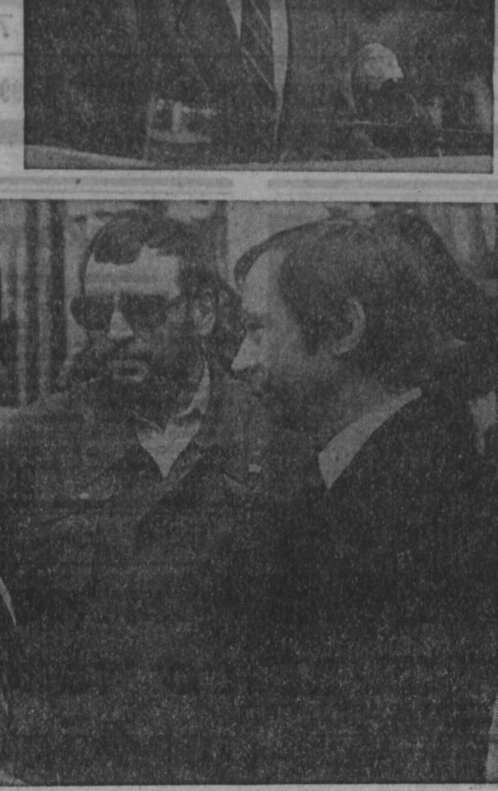
Участники конгресса патриотических сил в Кузбассе.

по восстановлению народного хозяйства. Ложь и обман — вот что такое ельцинская Конституция. Остается одна сила, способная противостоять неправам, — это Совет. Но нужно, чтобы там работали именно выразители интересов трудящихся, а не инертные и пугливые. Нужен четкий механизм отзыва депутатов, которые думают только о своем благополучии. Не перестать всех выступать. Сестры мнений на конгрессе были чрезвычайно широк. От словесных стачек, казалась, можно было ожидать развала работы форума. Но победила здравая мысль: разные по политическим взглядам делегаты сошлись на одном