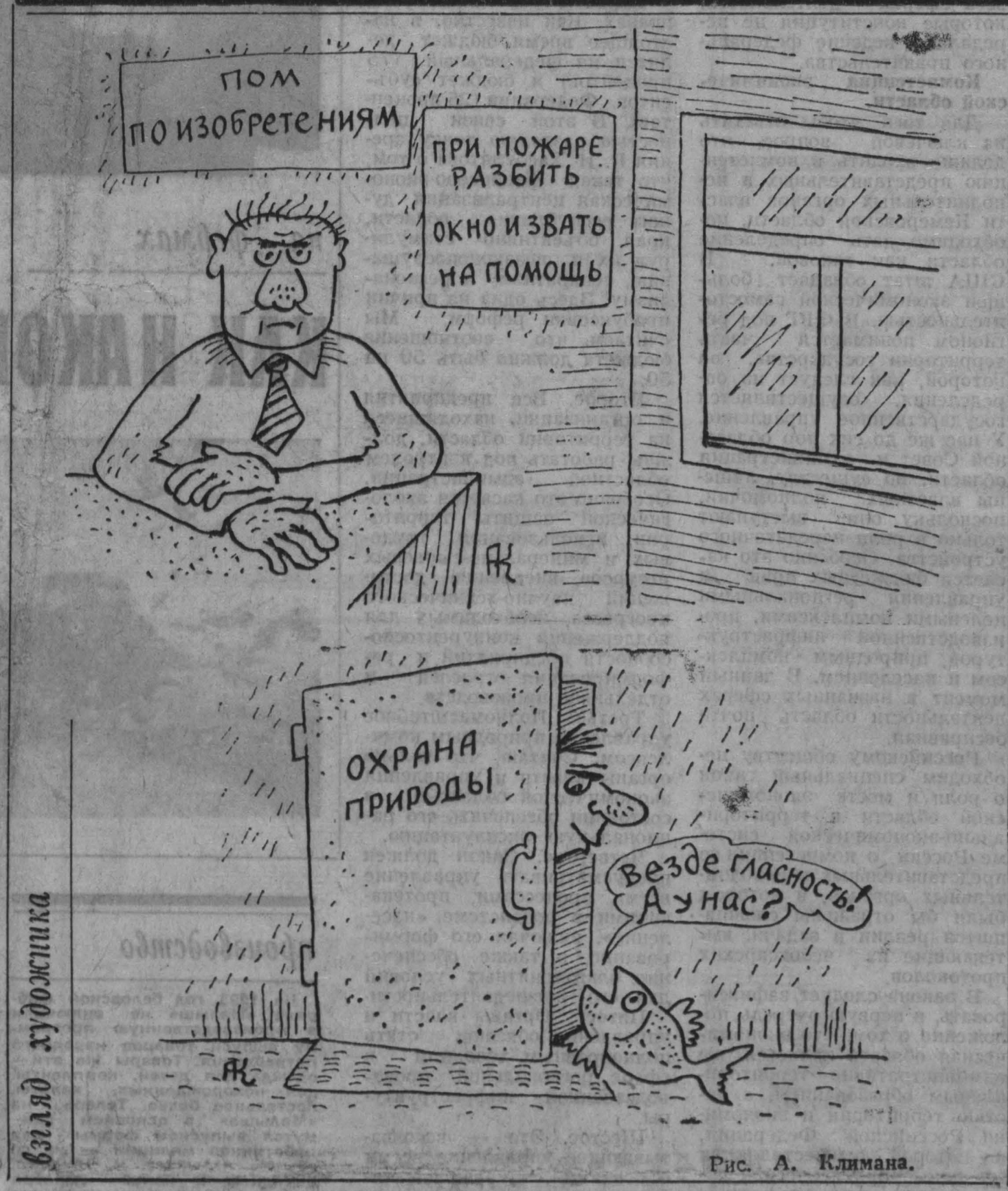
Рис. А. Климана.