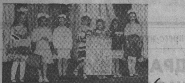
На этом снимке вы видите эпизод праздника в Пестниковской средней школе Ижморского района. Выступает группа «Искорки». Рассказ об этой необычной группе, а также стихи ее участников газета публикует сегодня.