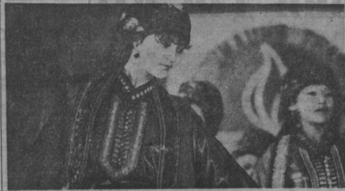
НА СНИМКАХ: молодая телеутка в праздничной национальной одежде. Платье из шелка, подвязанное ярким тканным поясом, украшенное серебряными пуговицами и пет-

лями, вызвало восторг европейцев еще в XVIII веке; телеутка с ребенком на улице села.