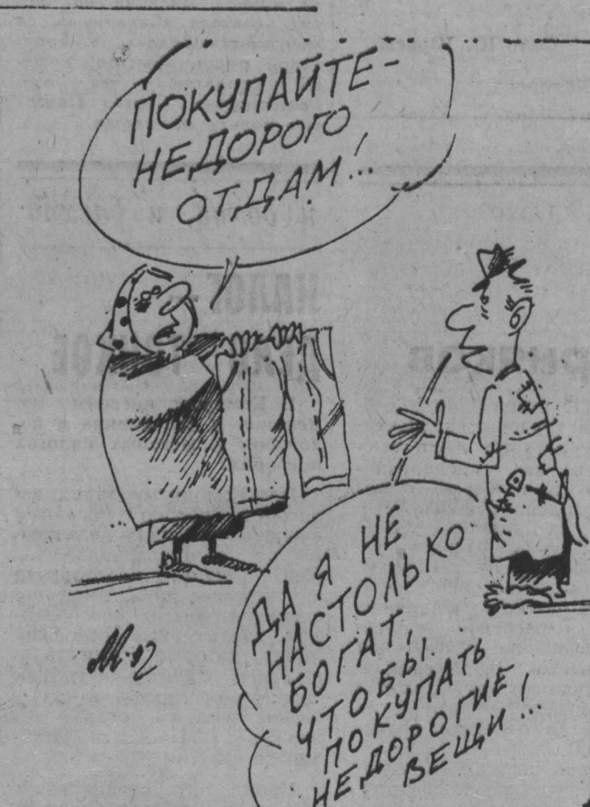
Рис. А. Левитяна.